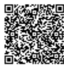
白井市住民健(検)診 申し込み

インターネットから申し込みができます。「白井市 検診 電子申請」で検索、またはスマートフォン、タブレット端末等で右の二次元コードから申し込みが出来ます。(携帯電話及びスマートフォンの一部から申請できない場合があります)