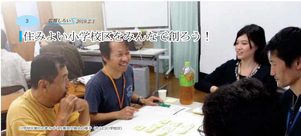
小学校区単位のまちづくり意見交換会の様子（大山口小学校区）