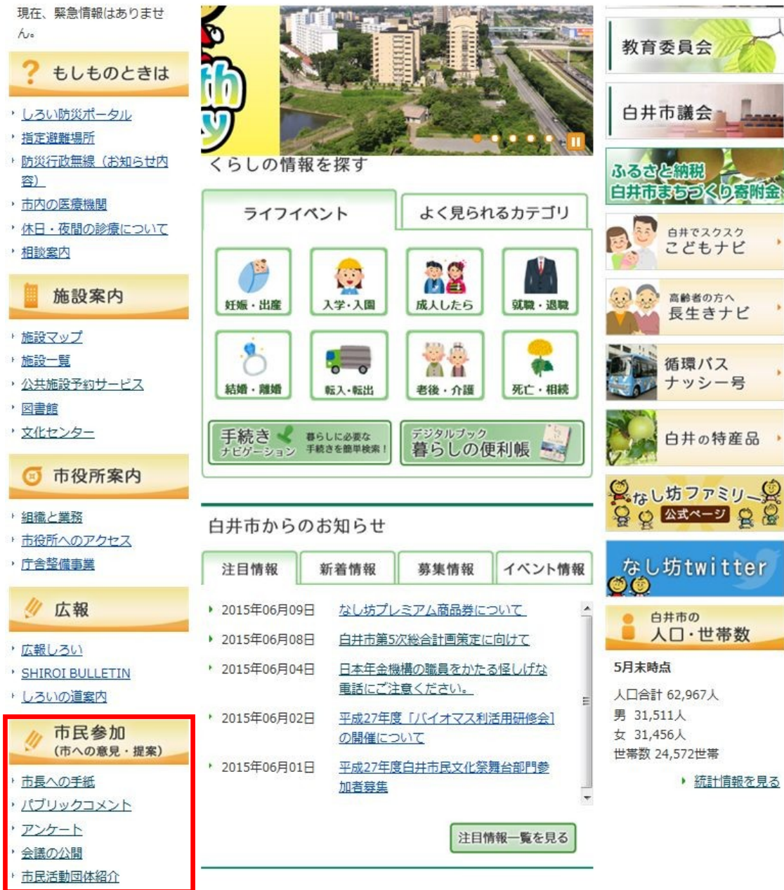
[図表 3] 市ホームページ・トップページ