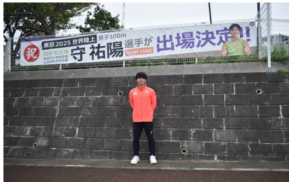
市役所前の横断幕と記念撮影した守選手