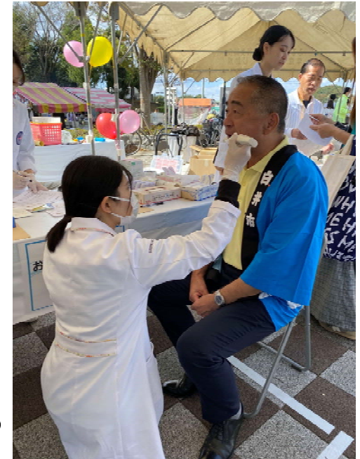
明海大学の学生による 口腔チェックの様子

目的：相互に緊密な連携を強化し、 協働による活動を推進し、 総合的な住民サービスの向上を図る。