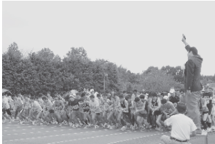
号砲とともにスタートする選手たち

10月2日に白井運動公園で白井梨マラソン大会が開催されました。大会には市民ランナーを始め市内外から約3,000人が参加し、さわやかな汗を流すとともに市特産の梨に舌鼓を打ちました。