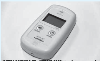
空間放射線測定器(環境放射線計 PA-1000)

貸し出し機器は大気中の放射線量(ガンマ線)を測定するためのもので、ベクレルで表示される食品や水、土壌などの測定はできません。