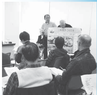
昨年の様子(双葉会による活動報告)

●●● 市民活動支援課市民活動支援班 内線3151・2、市民活動推進センター ☎(498) 0705