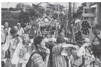
威勢良い掛け声とともに練り歩くみこし

参加した皆さんは法被を着込み、みこしを担いだり山車を引いたり、山車の上には太鼓や笛の音色とともにおはやしに合わせておかめや