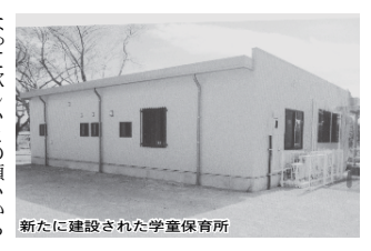
新たに建設された学童保育所

30分まで迎えにくるご家庭が少ない家庭のために、今年から午後7時までの延長保育も実施しています。土曜日を含め、夏休みなど学校の長期休業時は、午前8時から午後5時まで子どもたちも過ごします。 白井第三ゆうゆうクラブの生い立ちが平成8年にすでに就学している子の保護者や、まだ未就学の子の保護者の2人が、放課後の自分たちの子どもの過ごし方を心配し、1年以上の歳月をかけて準備し設立したもので、学童保育所でたくさん遊んで優しい子に