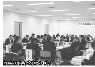
昨年の事業仕分けの様子

市で行う事業の必要性や実施方法を、外部の視点で公開の場において議論する事業仕分け