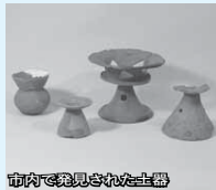
市内で見つかった土器

今回は皆さんの足元に眠る遺跡を身近に感じ、遺跡の大切さや郷土の歴史に関心を持ってもらうために、主に発掘調査以外の方法により発見・保管されてきた遺物を紹介します。