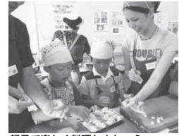
親子で楽しく料理しましょう

子どもが野菜を大好きになるように、子どもと保護者と一緒に料理を楽しめる講座です。