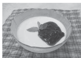
ミルクヨーグルトゼリー

材料(4人分) 牛乳125㍉、プレーンヨーグルト125㍉、粉ゼラチン5㍉、砂糖大さじ2、好みのジャムやフルーツソース小さじ4