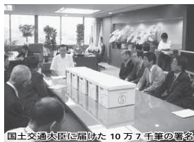
国土交通大臣に届いた 10万7千筆の署名