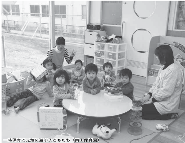
一時保育で元気に遊ぶ子どもたち（南山保育園）

市では、子どもが笑顔で暮らせるまちを目指して、「ついで子どもプラン」を策定し、保育サービスの充実や子育て支援事業の推進をしています。また子育てと仕事の両立や子育て中の親子の仲間づくりへの支援、相談体制の充実などを通じて市内で安心して子育てを産み育てていける環境づくりに取り組んでいます。