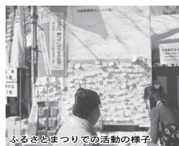
ふるさとまつりでの活動の様子