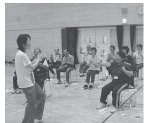
「笑顔で楽しく健康づくり」の講座風景