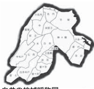
白井の地域呼称図

江戸時代までの白井は、多くの村に分かれていました。今も残る法目、中木戸などの呼び名はこの頃の村名に由来します。しかし、明治以降はその様相が大きく変わります。まず明治4年(1871)に廃藩置県が行われると、戸籍管理のために地区ごとに戸長が置かれ、翌年に経費節減のため太政官布告により村々の合併が促されました。白井では明治7年に各村が合併し、根村(白井木戸・中木戸・七次など)、復村(長殿・法目・富ヶ谷・富ヶ沢)、木村(所沢・野口、中村(中村新田)、が誕生しました。今の大字はこの村名に由来します。合併の背景には、学制に基づき学校を設置するため、財政力を高める必要があったと考えられます。次に大きく白井が変わるのは、明治22年(1888)の明治の大合併の時です。明治21年に中央集権的な地方自治体制を整備しようとする帝国会開設に向けて内務省から町村合併に関する訓令が出され、9月には千葉県から合併案が提示されました。それを受けて明治22年3月31日付けで県下一斉に町村合併が実施され、4月1日から町村制に移行しました。白井では平塚村が現