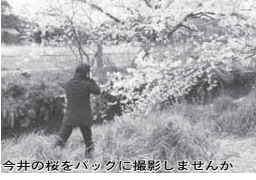
今井の桜をバックに撮影しませんか

写真撮影を楽しみたいカメラマンと和装好きなモデルを募集します。「桜」「ひと」「光」「風」など一瞬の出会いを切り取ってみませんか。