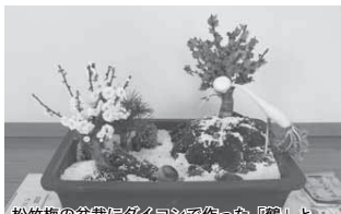
松竹梅の盆栽にダイオウで作った「鶴」とシイタケで作った「亀」を添えています

2月10日中（小名内地区）で「おびしゃ」が行われました。「おびしゃ」は弓を用いて農耕の作柄を占うところが多いようですが、ここ小名内地区では野菜を使って鶴と亀をつくり、高砂として崇めることで健康長寿や家内安全、農作物の豊作などを祈願するもので、この行事も約100年前から行われているようです。