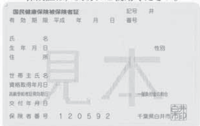
国保被保険者証（イメージ）

70から74歳までの国民健康保険（国保）被保険者が医療機関の窓口で支払う自己負担額の割合が平成26年3月31日まで「1割」に据え置かれたことに伴い、該当者は国保被保険者証の切り替えが必要になります。