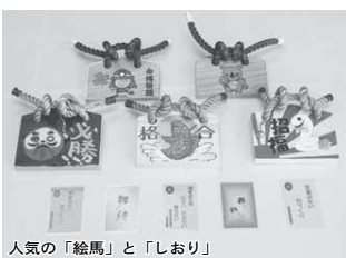
人気の「絵馬」と「しおり」

四つ葉のクローバーには幸せが訪れると言われています。大勢の皆さんに幸せが訪れるといいですね。