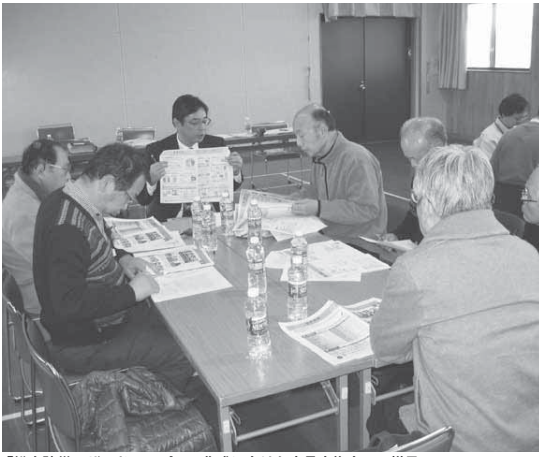
「総合防災ハザードマップ」の作成に向けた意見交換会での様子

市民や市民活動団体、事業者や市が情報と目的を共有し、それぞれの役割と責任を自覚して