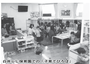
白井ふじ保育園での「子育てひろば」

※各子育て支援センターによって、行事などが異なりますのでホームページなどで確認するか直接問い合わせください。 清水口保育園「スマイル」☎(491)8201、南山保育園「ふれんど」☎(491)1131