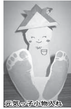
乳児と子小物入れ