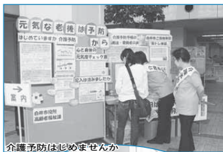
介護予防ははじめませんか