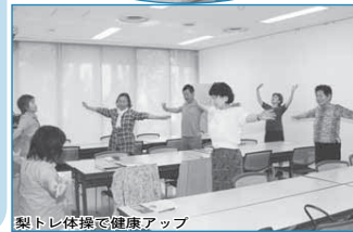
梨トレ体操で健康アップ