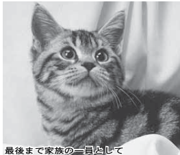
最後まで家族の一員として

飼い主のいない猫を新たに増やさないため、次の取り組みにご理解とご協力をお願いします。