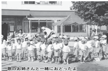
歌のお姉さんと一緒におどったよ

7月30日、ひまわり保育園(折立)で、NHKの「Eテレ」で放送されている、「えいごであそぼ」の収録が行われました。園児たちは、歌のお姉さんのキコさんや、キャラクターのボーと一緒に英語の世界を楽しみました。 放送日:17日(火)、19日(木) 午前7時35分～、午後4時5分～の朝、夕2回(放送内容は同じです)