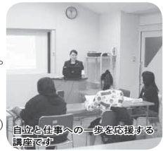
自立と仕事への一歩を応援する講座です

心や体をほぐすコミュニケーションと、仕事で活かせるワードやエクセルなどの基本を学びながら、働き方への不安を和らげる無料講座です。 講座終了後、自助グループ活動や社会貢献活動に参加することができます。 日程・内容 下表のとおり(全10回) 時間 仕事準備講座 午前11時～午後0時30分、パソコン講座 午後1時30分～3時30分 対象者 15歳から35歳までの独身女性で人とのコミュニケーションが苦手や職についても長続きせず働きづらさに悩む人10人(応募者多数の場合は選考基準により選考) ■ 10月7日(月)までに電話か直接福祉センターへ