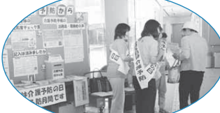
「介護予防の日」をアピールしました