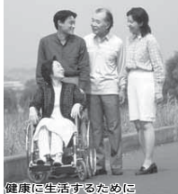
健康に生活するために

9月15日は「老人の日」です。また本日から21日(木)までは「老人週間」です。皆さん一人一人が身近なところで高齢者との関わりを深めたり、高齢期のあり方に関心を寄せるきっかけにしましょう。