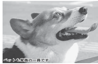
ペットも家族の一員です

動物愛護週間は、命ある動物の愛護と適正な飼育について、皆さんの関心と理解を深めるようにするため、法律で定められています。この機会に、ペットに限らず、身近にいる動物との関わり方を考えてみませんか。