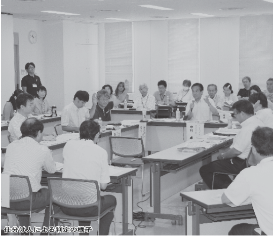
仕分け人による判定の様子

と市の担当職員が質疑などを行い、「市民判定人」が判定を行います。市民判定人は、市が無作為で抽出した800人のうち、参加を希望した人を市民判定人に選定し、延べ81人が参加しました。