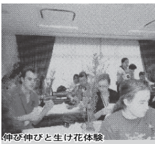
伸び伸びと生け花体験

のとおりです。 ◆初夏の生け花 フラワーアレンジメント展 6月15日、16日に白井駅前センターで、花の展示とチャリティー呈茶を催しました。花展では、それぞれがテーマを決め、季節の花を使って生け込みます。生け終わって後の達成感は何物にも代えがたいものです。花に癒され花から活力をもらっています。見た人から「初夏の爽やかな花をいつも楽しみにしています。」という言葉をいただきました。