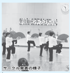
サークル発表の様子

サークルによる展示や発表、模擬店での販売、子ども縁日などを行います。 10月6日(日)は幼児から中学生まで(先着100人)を対象に、米1キロと交換できるスタンプラリーがあります。 日時 10月5日(土)・6日(日) 午前9時30分～午後3時 ※6日(日)の終了時間は午後2時30分です。 ◆福祉センターを臨時休館します センターフェスティバルの開催に伴い、10月4日(金)は臨時休館します。