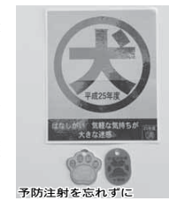
予防注射を忘れずに

トランプルは発生しています。また、動物に対し虐待行為を疑うような報告事例もあります。これらの問題を解決していくためには、飼い主が動物の習性や生体を理解して飼育するだけではなく、動物を飼っていない人も、動物の命を大切にしよう。配慮しましょう。