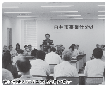
市民判定人による意見交換の様子