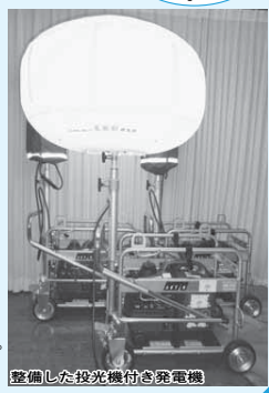
整備した投光機付き発電機