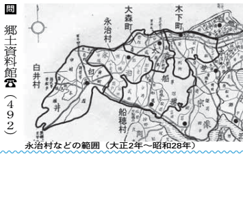
永治村などの範囲(大正2年~昭和28年)

ふるぎをたずねて 歴史のしずく 新しきを知る 永治村 永治村、白井村、谷清村は、明治22年(1889)に明治の大合併で誕生した村です。合併当初の永治村の範囲は、現在の印西市永治地区と白井市平塚地区で、手賀沼と印藤沼の両方に分水する台地を持ち、谷津に沿って畑畑集まる純農村地帯でした。「永久治平」に対する意識を込めて、「永治村」と名付けたと言われています。 白井村と谷清村の範囲は、現在の市の平塚地区を除いたものです。もともと千葉県が出した合併案では、両村を合わせたものでしたが、協議が整わず不成立となり、それぞれ白井村と谷清村を立ち上げました。両村とも規模や資力が小さかったため、組村力を組織することになりましたが、大正2年(1913)に組合村を解消して、単独の白井村が誕生し、谷清村は東隣の永治村に編入されました。 昭和22年(1947)に施行された地方自治法により、民主的な地方行政の骨格が定められます。そして昭和28年(1953)に町村合併促進法が公布され、昭和の大合併が始まります。 白井村と永治村は、町村合併促進法が標準とする規模に満たない村の一つで、他町村との合併を避けて通れぬ道