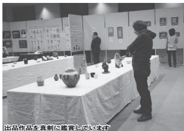
出品作品を真剣に鑑賞しています