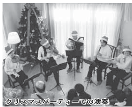
クリスマスパーティーでの演奏

11月15日号「まちの話題」で取り上げた、桜台小・中学校の「2,065人が作った紙帽子がぶり最多人数」が、10月12日にギネス認定されました。おめでとうございます。