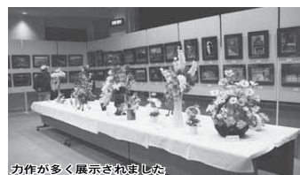
力作が多く展示されました

今年で57回目を迎えた白井市民文化祭が文化センターなどを会場として開催されました。会場では、市民の芸術・文化作品が展示され、来場者は芸術の秋を満喫していました。写真や陶芸、菊花、華道の展示、囲碁・将棋大会、芸能発表会、音楽祭、ダンスフェスティバルなどの催しも開催されました。