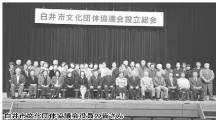
白井市文化団体協議会役員の写真

文化振興の貢献のため「白井市文化団体協議会」が誕生しました。協議会は、演劇演武、音楽、芸能、ダンス、伝統文化、園芸、国民音楽(将棋)、茶華道、写真、通信、陶芸、文芸など12専門部による62団体、1,170人で構成されています。