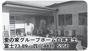
愛の家グループホーム白井富士 富士73-89 ☎(441) 5350

※上記の表は定員が9人以下の場合です。その他食費、部屋代、日常生活費が掛かります。要支援1の人は利用できません。