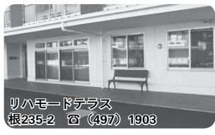
リハホームトデラス 根235-2 ☎(497) 1903