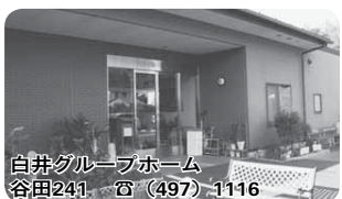
白井グループホーム 谷田241 ☎(497) 1116