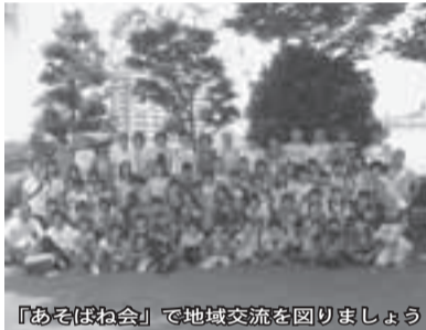
「あそばね会」で地域交流を図りましょう