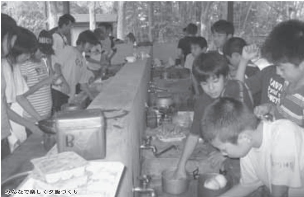
みんなで楽しく夕飯づくり