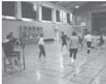
ソフトバレーボールで汗を流す皆さん

の」といった声を聞きます。子どもたちからは「全然、パパ・ママと遊べないよ」「外で遊ぶといたって場所がないしな」といった言葉を耳にするようになりました。総合型地域スポーツクラブはクラブを中心にして、地域の皆さんと一緒に、暮らしの中でスポーツを通して人と人とのつながり合い、これらの声の解決を目指しています。