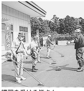
講習を受ける皆さん

7月18日(金) 午前10時30分～11時30分 対象 6カ月以上の子とその保護者 同日齢の子どもを持つお母さんたちの情報交換や友達づくりをしませんか。当日直接お越しください。 【バブちゃんランド】 日時 5月2日(金)、6月6日(金)、7月4日(金) 午前10時30分～11時30分 対象 6カ月未満の子とその保護者 【ちびちゃんランド】 日時 5月16日(金)、6月20日(金)