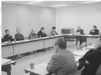
3月7日・只今会議中