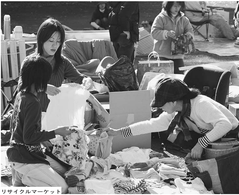
リサイクルマーケット