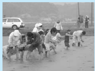
昨年のファミリー田植え体験

白井の米に関心と理解を深めてもらい、農業の活性化と地産地消の推進を目的に、JA西印旛農産物直売組合白井支部と共催で田植え体験を開催します。日時 5月17日(土) 午前9時～ 場所 木地区の水田（やおばあく付近）