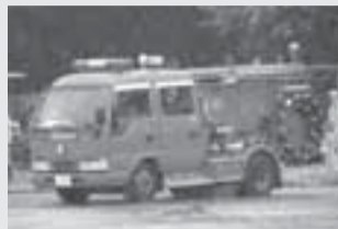
ポンプ自動車に乗る富塚部

消防団は消防署と連携を取りながら、消火活動などを行う組織です。昼間仕事を持ち、地元で働いている人や、サラリーマンとして他市で働いている人などが有償ボランティアとして入団し、ポンプ中継や救急搬送の訓練などを受け、活動しています。