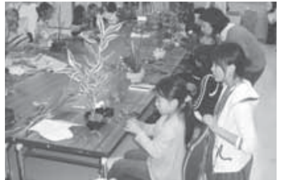
華道展のいけこみ風景