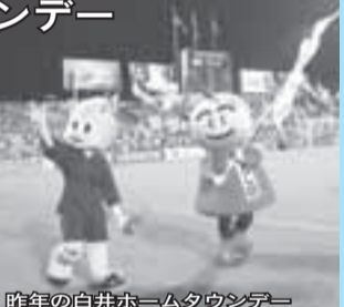
今年の白井ホームタウンデー

毎年「白井ホームタウンデー」を開催し、市やしろい梨のPRを行っています。今年のホームタウンデーはFC東京戦です。当日は抽選で200人にしろい梨(2.5kg箱)をプレゼントします(抽選券は先着2,000人に配布します)。 日時 28日(木) 午後7時キックオフ 場所 日立柏サッカー場