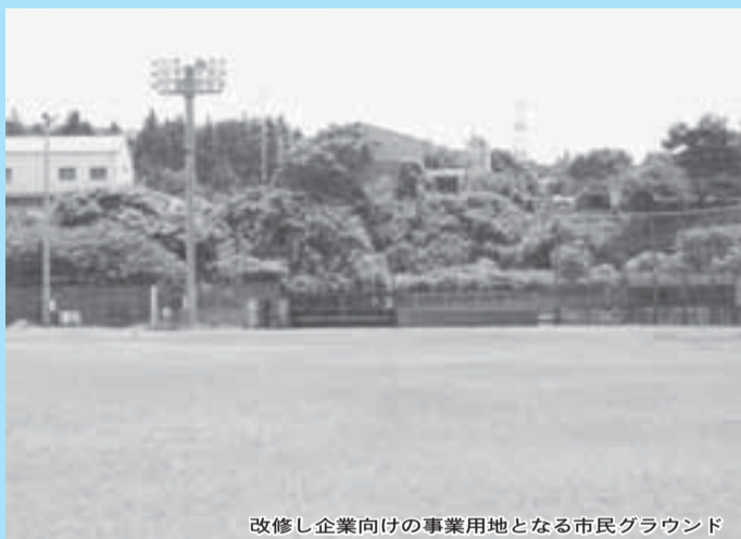
改修し企業向けの事業用地となる市民グラウンド

市では産業の振興、市民雇用の促進および企業立地による税収の確保などを目的に企業誘致を推進しています。白井工業団地内への進出を希望する企業は大変多く、また事業所の拡張や集約移転などを希望する企業もあり、事業用地の需要は非常に高くなっていますが、その確保が大きな課題となっています。このようなことから白井第二工業団地内にある調整池の一部を改修し、企業向けの事業用地を創出することとしました。このことに伴い、調整池に併設されている市民グラウンドは使用できなくなるため、本年11月1日(土)に廃止します。