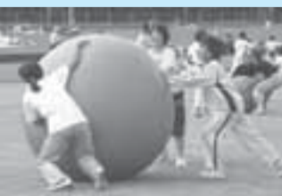
昨年のスポーツフェスタ

スポーツフェスタ2008のゲームやレクリエーションなどを行うスタッフとして、スポーツフェスタを盛り上げてみませんか。 日程 10月12日(日)（雨天の場合は13日(祝)） 場所 白井運動公園 対象 高校生以上 申込 8月29日(金)までに、はがきに住所・氏名・連絡先を記入の上、郵送または直接生涯学習課スポーツ振興班 内線3436へ