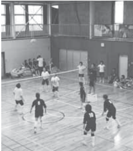
学校運動施設を利用する皆さん

小・中学校体育施設を定期的にご利用する場合、原則団体利用の登録が必要です（必ずしも希望する日時で定期的にご利用ができません）。 利用施設 校庭、体育館、柔剣道場、庭球場 ※校庭での子どもの硬式野球と