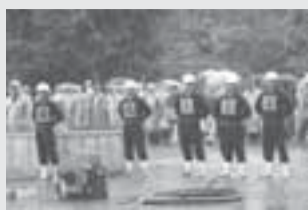
敢闘賞を受賞した七次部

第28回(勸)千葉県消防協会印旛支部消防操法大会が6月29日に栄町で行われました。白井市消防団からは第2分団七次部が小型ポンプの部に、第3分団富塚部がポンプ自動車の部に出場し、七次部が見事敢闘賞に入賞しました。