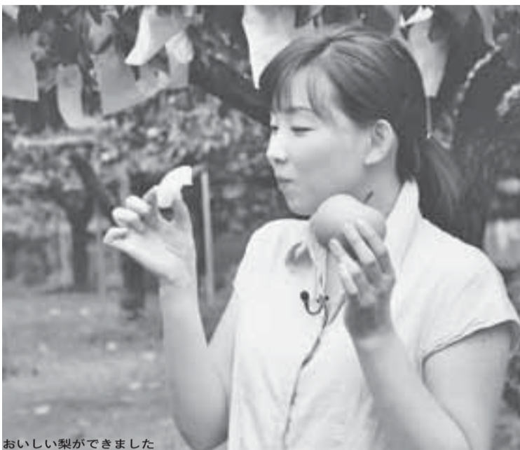
おいしい梨ができました

市特産の梨の季節がやってきました。白井の台地は関東ローム層という火山灰土壌で、水はけがよく梨栽培に適しています。そのため「幸水」「豊水」「新高」などの梨作りが盛んで、この時期、市内各所でおいしい梨が直売されています。