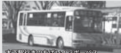
木下駅行きのちばレインボーバス ☎ 0476 (46) 0022、市企画政策課企画政策班 内線3353

ちばレインボーバス(株)が運行している木下線(白井駅～白井車庫～木下駅、白井駅～谷田)が、利用客の減少などの事由により3月31日(火)の運行を最後に廃止されます。