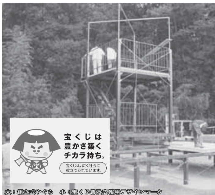
大：組立式やぐら 小：宝くじ普及広報用デザインマーク

清水口地区自治会連絡協議会では、(財)自治総合センターから一般コミュニティ助成を受け、夏まつりに使用する組み立て式やぐらを購入しました。