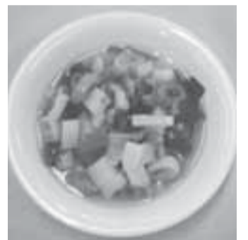
長ねぎの和風コンソメスープ

材料（2人分） 長ネギ1本 ジャガイモ1/2個 キャベツ1枚 ニンジン20g 固形コンソメ1/2個 水300cc ワカメ（乾燥）適量 しょうゆ小さじ1 塩・コショウ少々 作り方 ①長ネギを小口切りに、キャベツ・ジャガイモ・ニンジンは1センチ角に切る ②鍋に各野菜と水を入れ強火で煮る ③煮立ったら火を弱めて5分煮て、ワカメを入れてしょうゆ・塩・コショウで味を調える