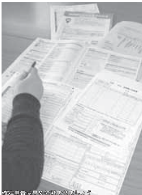
確定申告は早めに済ませましょう

2月16日(月)から市・県民税の申告と所得税の確定申告の受け付けが始まります。3月に入ると申告会場は大変混雑しますので、早めに申告を済ませましょう。