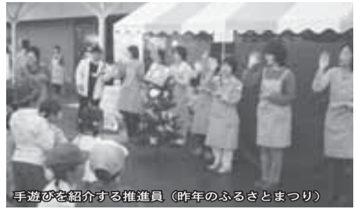
手遊びを紹介する推進員（昨年のおふろけまつり）

活動日 年30日程度（主に平日） 対象 子育ての経験があり、子育て支援に関心のある人 大口中学校区3人、白井中学校区1人、南山中学校区1人、七次台中学校区2人、桜台中学校区1人