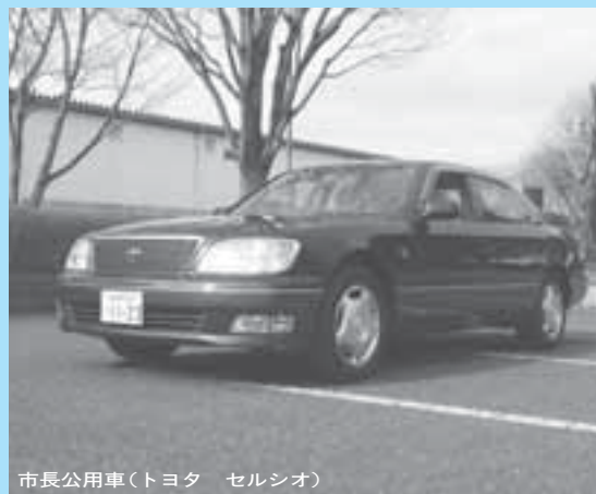
市長公用車(トヨタ セルシオ)

市ではこれまで市長が公用車として使用してきた車を一般競争入札で公売します。入札参加を希望する人は詳しい内容を市役所前掲示板または市ホームページで確認の上、申し込んでください。