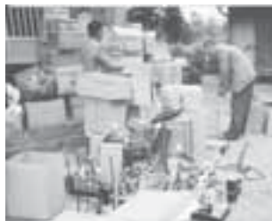
栗島神社の雛人形供養

栗島神社は市内では名内地区のみに存在し、近隣でも数少ない、この地域では珍しい神社です。一般的には淡島神社とも呼ばれ、和歌山県和歌山市加太の淡島神社が総本社だと言われています。 名内地区の栗島神社は元来は少名彦命を祭神とし、現在は素戔嗚命を合祀しています。大正4年(1915年)発行の「白井村誌」によると、この神社は戦国時代の永禄年中(1558～1570年)に、千葉氏の家臣で名内村の領主だった伊東守胤が、和歌山県の淡島神社の総本社から神霊を招祭してきたと伝えられています。また祭神の少名彦命は、一説には名内の地名の由来に関係しているとも言われています。栗島神社はその後、江戸時代の宝暦7年(1757年)に再建され、現在の本殿は明治40年(1907年)に改築されたものです。