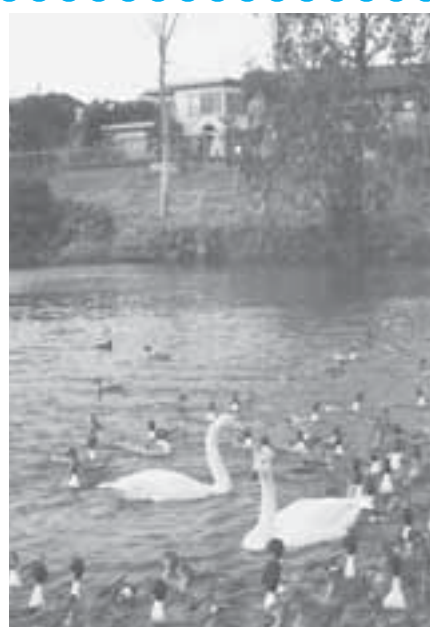
清水口調整池のオオハクチョウ