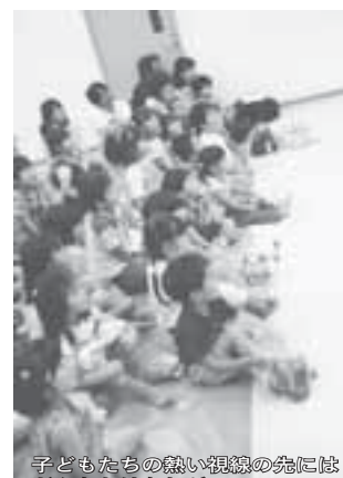
子どもたちの熱い視線の先にはどんなおはなしが...

子どもを好きな人、演ずる人、お話大好きな人、個人やグループで活動している人などが集まり、交流しながらゆっくりと人形劇まつりの準備をしています。まつりに集まる皆さんのニコニコの笑顔をイメージしながら、月1回集まり持ち寄った情報からアイデアを出し合っています。半年前のプレ公演で「身の回りの物を使った簡単人形劇」とワークショップ「作ってみせる小さい人形劇」に参加したことで未来の芸達者が育ったようです。