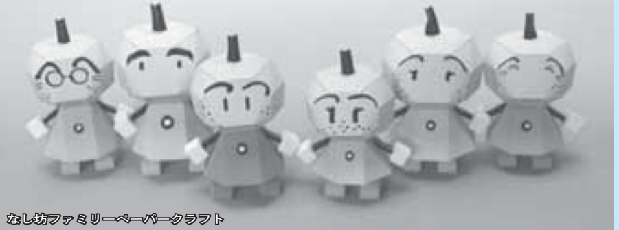
なし坊ファミリーペーパークラフト

市の現在の人口は、住民基本台帳、外国人登録原票を元に積算した人口で、59,768人(平成20年12月末現在)です。現在の人口増加を考えるともうすぐ人口は6万人に達します。