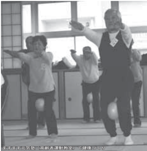
ますます元気熟(高齢者運動教室)で健康づくり