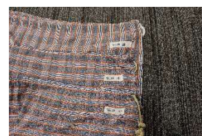
収納袋 （右上タグを確認の上 収納してください）