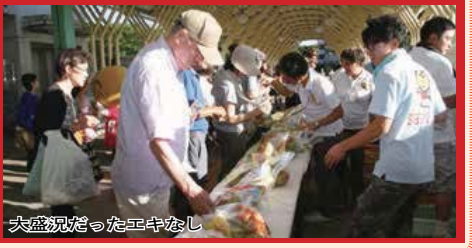
大盛況だったエキなし