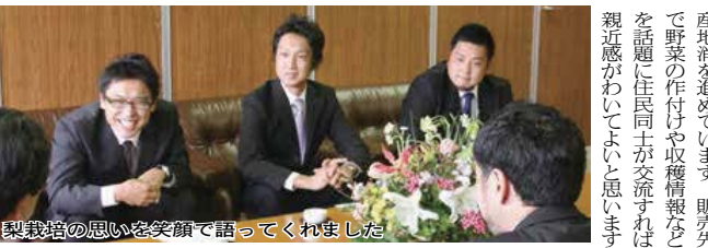
梨栽培の思いを笑顔で語ってくれました

たかいていますけれど、本当に忙しい時はほんのわずかですから、その時に労働力を皆さんに提供できれば、組合としても考えられます。 市長 毎年市民大学校の高齢者の生徒が75人くらいいます。その中に農業をしたいという人が結構いますが、資本がかかるということと、まとまった農地が見つかりません。 一方、後継者がいない農家も今後増えていきます。市が間に入って農地の貸し借りなど、うまくマッチングができれば新たな就農者の誕生と、農家はある程度の賃金収入を得ることができそうです。そういう仕組みを進めようと考えています。 もう一つは、ニュータウンという大きな消費地があるので、昨年の8月から農産物の移動販売をJA西印旛にお願いして地産地消を進めています。販売先で野菜の作りや収穫情報などを話題に住民同士が交流すれば親近感がわいてよいと思います。