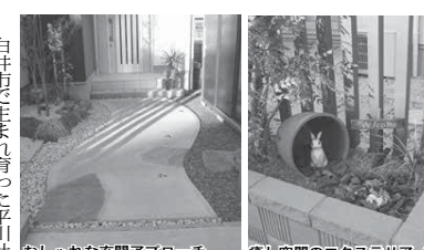
癒し空間のエクステリア（外構）