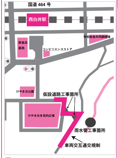
上下水道課計画建設班 内線3452

工事日程 ~7月下旬 午前9時~午後5時 工事箇所 下図 工事内容 雨水管を地中に埋設する工事 交通規制区間 下図の部分車両交互通行