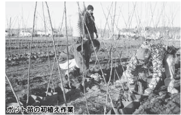
ポット苗の初植え作業