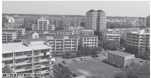
緑に包まれた桜台小学校区

「土地利用」「都市施設」「都市環境」「都市景観」「都市防災」の5つの分野に分け基本方針を定めています。