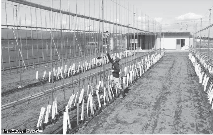
整備中の育苗センター

発行 / 白井市 編集 / 秘書広報課 毎月2回1日・15日発行 〒270-1492 白井市復1123 ☎047(492)1111 FAX 047(491)3510 URL http://www.city.shiroyi.chiba.jp/