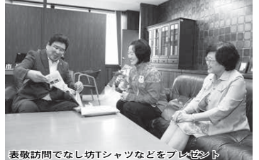
表敬訪問でなし坊Tシャツなどをプレゼント

観覧料 市内在住大人210円 子ども100円、市外在住大人 320円、子ども160円 プラネタリウム館 ☎ (492) 1125