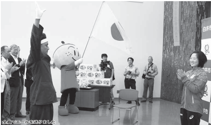
全員でエールを送りました