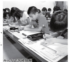
みんなが写経体験