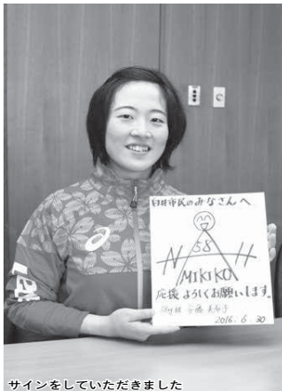
サインをしていただきました