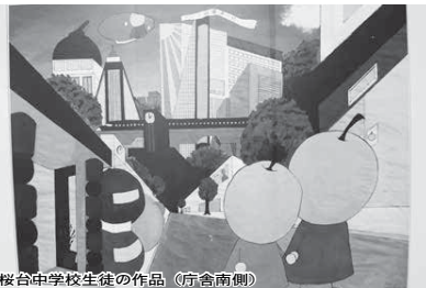
桜台中学校生徒の作品(庁舎南側)

現在、工事を進めている市役所庁舎の新築棟建設地では、工事現場の北側と南側の2カ所の仮囲いに市内の保育園、幼稚園、小・中学校、高校の園児、児童、生徒の皆さんが「未来の白井市」をテーマに制作した絵画を展示しています。