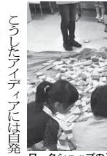
職人の作業の様子