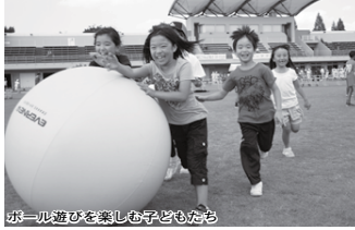
ボール遊びを楽しむ子どもたち