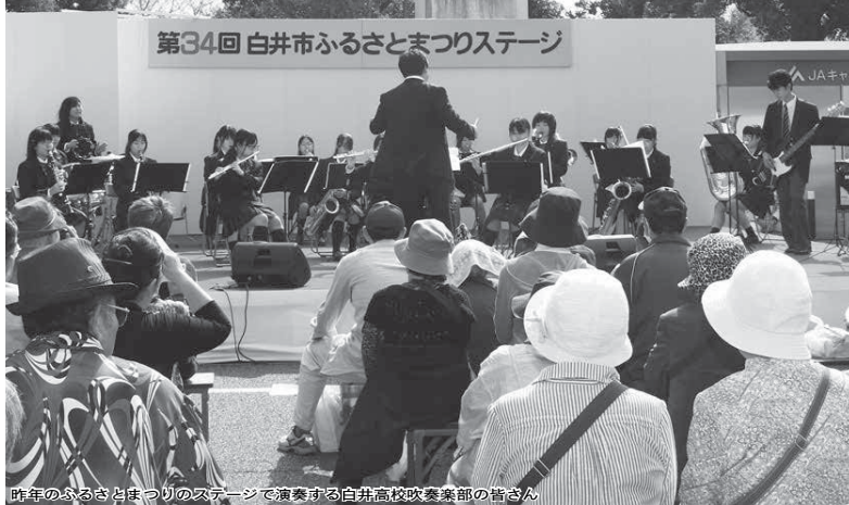
昨年のふるさとまつりのステージで演奏する白井高校吹奏楽部の皆さん

発行 / 白井市 編集 / 秘書広報課 毎月2回 1日・15日発行 〒270-1492 白井市復1123 ☎047(492)1111 FAX 047(491)3510 URL http://www.city.shiroyi.chiba.jp/