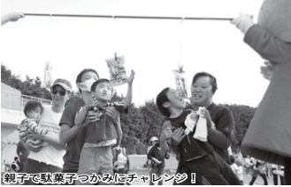
親子で駄菓子つかみチャレンジ

※当日は無料送迎バスを運行します。時刻表は市ホームページと6日(休)の新聞折り込みでお知らせします。昼食は各自で用意してください。