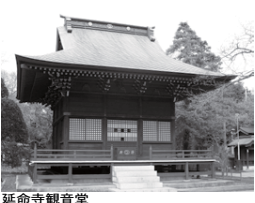
延命寺観音堂 文化課文化班(492) 1123