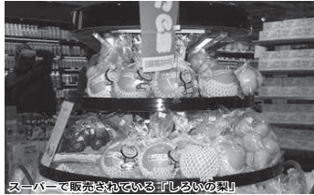
スーパーで販売されている「しろいの梨」