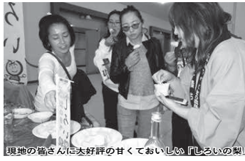
現地の皆さんに大好評の甘くておいしい「しろいの梨」