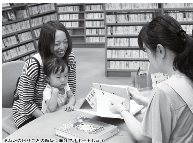
あなたの困りごとの解決に向けてサポートします

◆ 本の出会いをお手伝い 「何を読んだらいいかわからない」というとき、お気に入りの1冊を見つけてあげることができる。図書館員おすすめの本のリストや企画展示、季節の展示を用意しています。