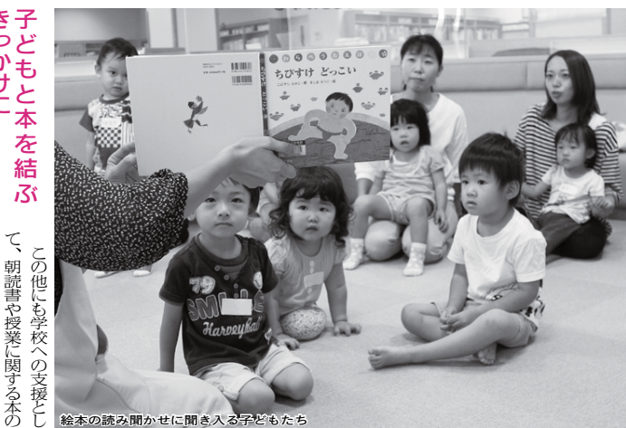
絵本の読み聞かせに聞き入る子どもたち