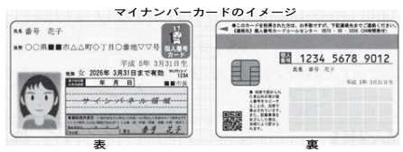
マイナンバーカードのイメージ 本人確認書類の例 ※写しを添付しない場合は、税務署の窓口で本人確認書類を提示してください。

マイナンバーカード(個人番号カード)か、通知カードまたはマイナンバーの記載のある書類と運転免許証など(写しの添付も必要)