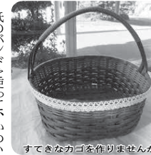
すぐなカゴを作れませんか