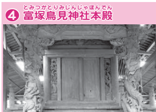
④ 富塚鳥見神社本殿

今井地区は手賀沼に近い低地にあり、家の敷地より一段高く築いた塚の上に建物而建てられ、洪水の際はここに避難しました。