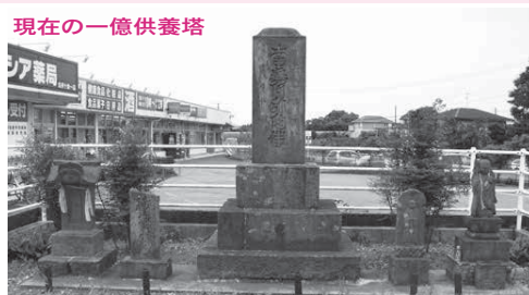
現在の一億供養塔

「印西牧場之真景図」は、牧と深いかわりを持った市の歴史を物語る貴重な資料で、江戸時代に神々廻、谷田、清戸、十余一から印西市にかけて広がっていた印西牧で行われた野馬捕りが描かれたびょうぶ絵です。