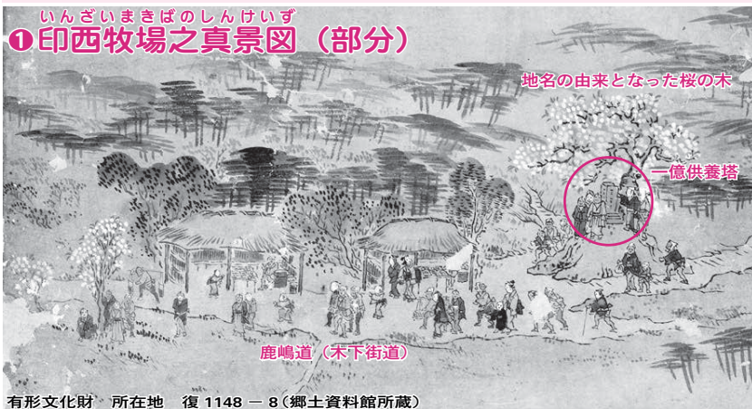
いんざいまきばのしんけいず ① 印西牧場之真景図 (部分)