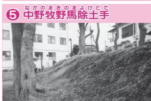
⑤ 中野牧野馬除土手

元は市川市の葛飾八幡宮にありましたが、廃仏毀釈(※)の際に来迎寺に引き取られたものです。写真の仏像は鎌倉時代のものです。