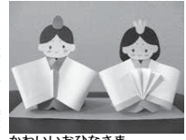
かわいいおひなさま

ふれあい遊びやボール遊びを楽しみましょう。 日時 2月1日(日) 午前10時30分～11時 対象 生後7カ月～1歳未満の子とその保護者(自由参加)