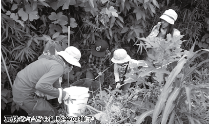
豆の字も観察会の様子