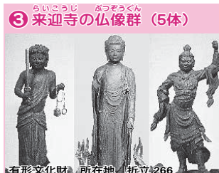
③ 来迎寺の仏像群 (5体)

【開館時間】午前9時～午後5時 【休館日】月曜日、年末年始、その他、展示替えなどのため必要があるとき 【入場料】無料 ☎ (492) 1124