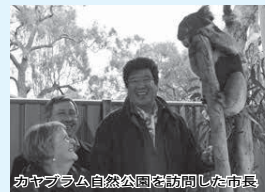
カヤブラム自然公園を訪問した市長

互いの市を訪問し、市民同士の交流・親睦を深め、ホームステイなどにより異なる生活習慣や文化を体験することで、国際理解を推進します。隔年で実施し、これまでに延べ272人がキャンパスピ市を、延べ231人が白井市を訪れています。