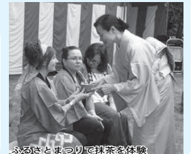
ふるさとまつりで抹茶を体験

オーストラリアの国土のように気持ちがおおらかで、心の大きな人たちがばかりでした。良い意味で人生観が変わるほどのカルチャーショックを受けました。旅行では味わえない貴重な経験ができるこのチャンスを体験してほしいと思います。