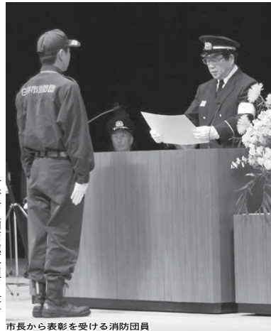
市長から表彰を受ける消防団員

市では、新春恒例の消防出初め式を1月15日に文化会館なし坊ホールで行い、消防団員や消防職員合わせて235人が参加しました。