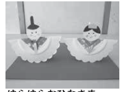
ゆらゆらおひなさま