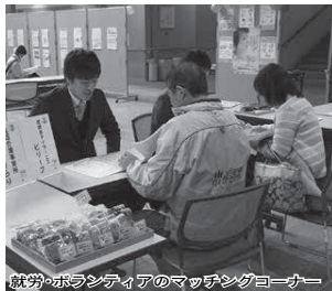
就労・ボランティアのマッチングコーナー

※求人やボランティアの充足状況により変更の場合があります。 ☎ 地域包括支援センター ☎ (497) 3474