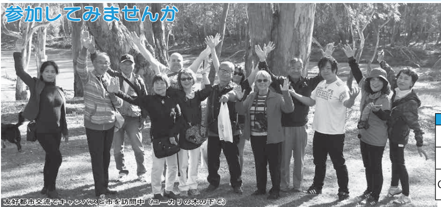
友好都市交流でキャンパスピ市を訪問中（ユーカリの木のすぐ下）