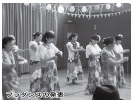
フラダンスの発表

★ 白井駅前センターフェスティバル 日時 2月25日(土)・26日(日) 午前9時30分～午後3時30分 内容・日程・プログラム 下表のとおり