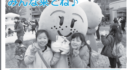
みんな来てね! 【日時】 12 日(日) 午前 11 時～午後 5 時 ※雨天決行(ステージのみ中止) 【会場】 北総線白井駅前南口広場 ※詳細は市ホームページをご覧ください。 ※フェスティバル専用駐車場はありません。公共交通機関、有料駐車場、有料駐輪場をご利用ください。