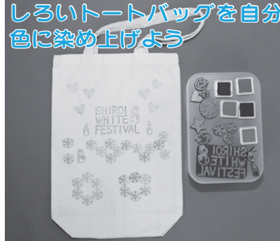
しろいトートバッグを自分で染め上げよう 用意されたしろいトートバッグをペンやスタンプでペイントし、自分だけのオリジナルトートバッグを作りましょう(参加費100円)。