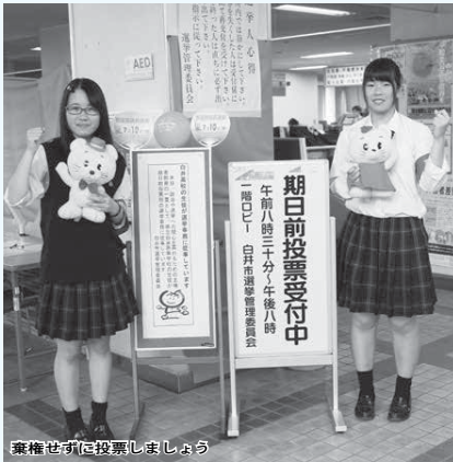
棄権せしめに投票しましょう