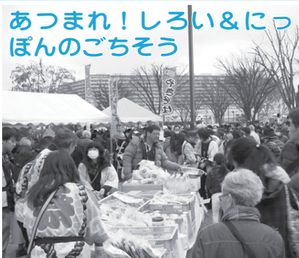
あつまれ! しろい&にっぽんのごちそう 白井の特産品や、にっぽん全国から集まったごちそうなどをお楽しみください。