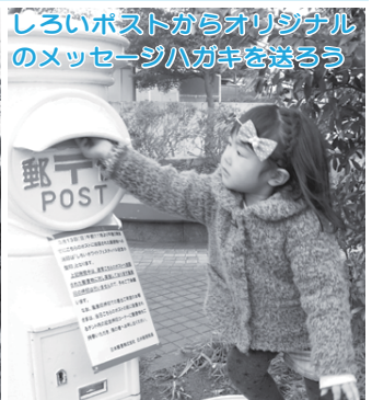
しろいポストからオリジナルのメッセージハガキを送ろう あなたの大切な人に、しろいポストから当日限定のオリジナル消印を添えて送りましょう(午後3時まで、参加費50円)。