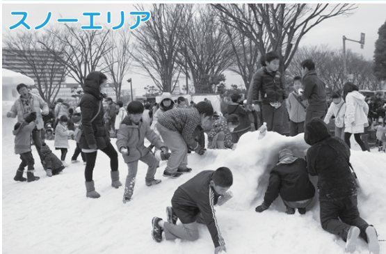
スノーエリア 白井駅前「梨の泉」に東北から雪を運んできます。「スノートレジャーハンティング」(見つけたおもちゃは1人2点まで持ち帰ることができます。参加費100円、先着100人、整理券を午前11時から配布します)「ストラックアウト(無料)」で遊びましょう。

市では、昨年からホワイトデー(3月14日)を「しろいの日」としました。「白」をテーマに、雪を使った遊び、おいしい食べ物や白井の特産品、子どもから大人まで楽しめるステージなど、「しろいの日」を祝うイベントが盛りだくさんです。家族や友達を誘って皆さんでご来場ください。 しろいホワイトフェスティバル実行委員会事務局(企画政策課内) 内線3351、3