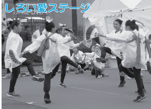
しろい愛ステージ 「白井」に対する愛情いっぱいの演奏やダンスを披露します。しろいコスプレ・仮装コンテストやご当地キャラステージもあります。