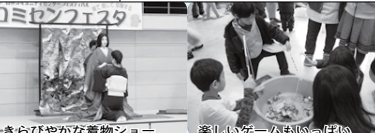
きらびやかな着物ショー 楽しいゲームもいっぱい