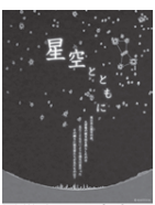
震災当日の夜空を眺めてみませんか

※キャンセルは、15日(木)までに連絡してください。 ●日時 19日(日)までに電話か直接運動公園(497)0222へ ●参加費 1組2,500円(保険代ほか) ●目的 震災当時の星空の記憶を風化させずにおこころ宮城県仙台市天文台が作成した番組を当市をはじめ全国27館のプラネタリウムで放映します。あの時のあの空を忘れず、星や星空の力を実感する番組です。 ●日時 4日(土)・11日(日) 午後4時10分～(45分間) ●定員 一般 86人(先着順) ●料金 無料 ●※午後3時40分から3階窓口で整理券を配布します。 ●プラネタリウム館(49)1125