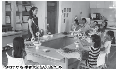
いけばなを体験する子どもたち

「ドリムチャレンジャー」は小学校3年生（チャレンジャー）が地域の大人や団体（サポーター）から学び・体験すること、将来の夢を見つめるきっかけ作りと人のつながりを地域全体で支える子育て応援事業です。 チャレンジャーの皆さん、3月31日（金）までにコインを持ってさまざまなジャンルを体験し