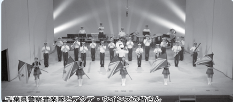
千葉県警察音楽隊とアクア・ウインズの皆さん

日時 7月15日(日) 午後2時～(開場 午後1時30分) 場所 文化会館なし坊ホール 対象 一般 798人(車いす席含む) 出演 千葉県警察音楽隊 千葉県警察カラーガード隊「アクア・ウインズ」 入場料 無料(全席自由) 文化会館 ☎(492) 1121