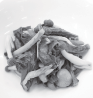
小松菜とシメジの煮びたし

小松菜とシメジで簡単に作れる副菜です。シメジは煮物、炒め物、揚げ物など、どの調理法でも使いやすいほか、うまみがあり味にクセがないため和洋中と幅広く料理に使える便利な食材です。