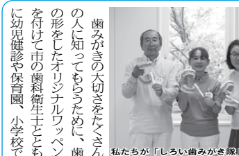
私たちが「しろい歯みがき隊」です