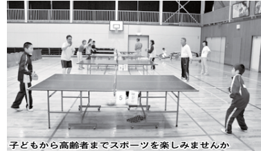
子どもから高齢者までスポーツを楽しみませんか