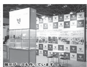
展示ブースも作っています

その合間にさまざまな発明を行い、やがてヒット商品や特許品が生まれ会社が軌道に乗って出し、自社生産を増強するため白井に土地を求めて平成10（1998）年に工場を建て、本社を移したそうです。