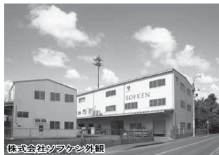
株式会社ソフケン外観

初は自宅まで紙と鉛筆だけでアイデアを特許にした友人たちの手伝いをする受託開発を始めました。