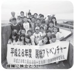
平成28年度 房総アドベンチャー 平成28年7月23日～28日 白井市教育委員会 冒険に旅立とう!

市では、自分たちで立てた計画に基づいて行動する「房総アドベンチャー」を実施します。