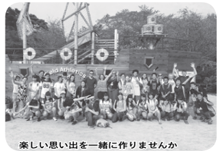
楽しい思い出を一緒に作りませんか

9月に行われる青少年国際交流事業で、市の友好都市キヤンパス市とランバンク市から来日する先生と保護者の宿泊場所や食事の提供、市役所や中学校への送迎などを受け入れてくれるホストファミリーと、市内の小・中学校で通訳として協力できる人を募集します。