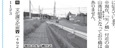
現在の矢ノ橋付近