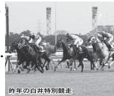
昨年の白井特別競走

日程 9月18日(木) 場所 日本中央競馬会中山競馬場(船橋市) 競走名 第4回中山競馬第5日目第9競走 白井特別競走