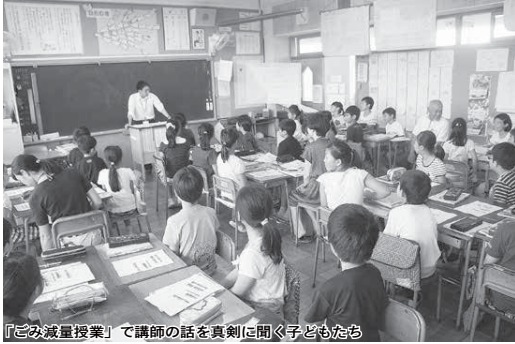
「ごみ減量授業」で講師の話を真剣に聞く子どもたち

市では、家庭から多く出る生ごみの減量や、資源物の分別などについて話をする「ごみ減量講座」や「なるほど行政講座『白井のごみを減らそう！（ごみとリサイクル）』」を実施し、ごみの減量化・資源化を推進しています。 その取り組みの一環として、6月30日に池の上小学校4年生を対象として「ごみ減量授業～白井市のごみをへらそう～」を実施しました。 子どもたちは「生ごみの水切り」や「分別」をテーマに授業を受けたり、ゲームを楽しみながら、ごみを減らすことについて学びました。 授業を受けた子どもたちからは、「白井市の1年分のごみの量は思ったより多くてびっくりした」「使い終わったペットボトルは燃やすごみに捨てていたけど、リサイクルできることを学習してリサイクルしようと思った」「食べ物を残さないように頑張ろうと思った」など、たくさんの感想がありました。 講座の開催可能日時は、年末年始を除く毎日の午前9時から午後9時までです。講座の開催を希望する自治会や団体は問い合わせてください。 ※会場の手配は講座依頼者が行ってください。日程は相談となります。