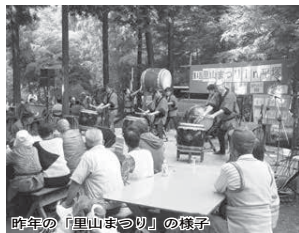
昨年の「里山まつり」の様子

● NPO法人しろい環境塾 後藤 ☎ (404) 3298 (月・水・土曜日 午前10時から午後3時まで)