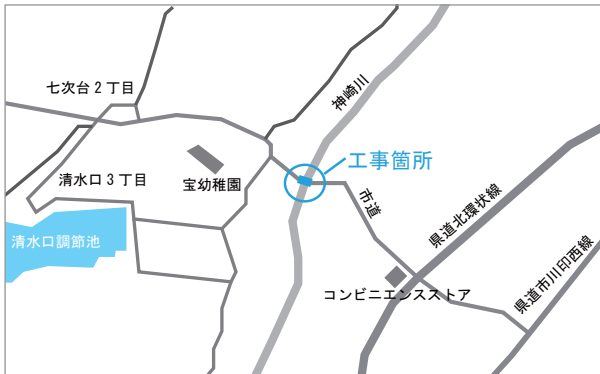
独立行政法人都市再生機構首都圏ニュータウン本部 ☎0476(46)8945、道路課維持管理班 内線3217

神崎川の改修に伴い七次橋架け替え工事を行っています。橋の工事の一部が完成し、7月下旬に迂回路から市道への切り替えを行いました。 今後も河川改修工事、迂回路撤去工事、橋接続部の道路工事などを行いますので、協力をお願いします。 工事完成予定日 平成30年1月31日(木) 工事時間 午前8時～午後5時 ※日曜日は原則として工事を休止します。