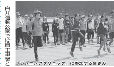
「ラジニングクリニック」に参加する皆さん

白井運動公園には陸上競技場、テニスコート、競技広場があります。市民のスポーツ、レクリエーション活動の拠点として市民相互の融和とスポーツ振興を図ることを目的に部活動、陸上競技大会、サッカー大会、ケニアゴルフ大会など利用はさまざまです。利用者の皆さんに安心して使用していただくよう施設の整備や各種機器の点検、