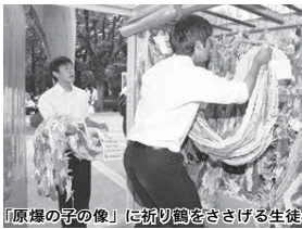
「原爆の子の像」に折り鶴をささげる生徒

白井中学校3年生が6月28日から30日に修学旅行で広島を訪れ、昨年の青少年国際交流で派遣した市内中学生とともに友好都市キャンパスビ市カヤプラム校とプリンバンク市キーロー校の生徒が「平和事業」の一環として作製した折り鶴612羽と白井中学校3年生が作製した折り鶴を平和記念公園内の「原爆の子の像」にささげました。 白井中学校では平和を愛する人の輪を広げるため、広島市から被爆アオギリ二世の苗木を受け取り、7月10日に植樹、成長を見守りながら平和の願いをつなげていきます。 企画政策課男女共同参画室 内線3354