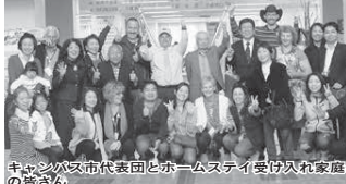
キャンパスビ市代表団とホームステイ受け入れ家庭の皆さん

④・⑤ ①は9月11日(月)、②は9月29日(金)までに住所、氏名、電話番号、メールアドレスを電話かファクス、メールで企画政策課男女共同参画室 内線3354・5、☎kikaku-seisaku@city.shiroi.chiba.jpへ