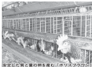
安定した質と量の卵を産む「ボリスブラウン」

自家製のバランスの良い飼料で育った健康な鶏が産む、濃厚で甘みが際立つこだわりの卵はファンを広げています。飲食店や洋菓子店からも「茶わん蒸しがおいしくできる」「ケーキのフロンがふっくらできる」と大好評です。文化センター内の「カフェ・プラン」の手作りプリンとケーキや和菓子店「さつまや」のふろこや菓子のどら焼きにも使われています。