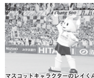
マスコットキャラクターのレイくん