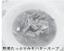
野菜たっぷりみそパタースープ

夏バテで疲れが残っているのは野菜が不足しているサインかもしれません。みそパターの風味を生かしたスープで野菜を補いましょう。野菜に含まれる水溶性の栄養素もスープと一緒に取り入れられます。