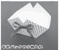
牛乳パックの小物入れ

どなたでも参加でき楽しく交流できるサロンです。 ゆっくりお茶を飲みながら「認知症のこと」「アルツハイマーのこと」「介護のこと」などについて施設職員や専門職から話が聞ける「ひだまりカフェコーナー」もあります。 ※申し込みは不要です。