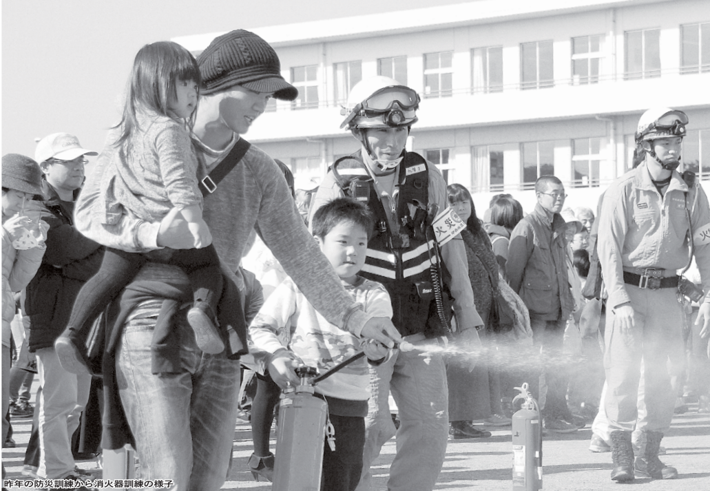
昨年の防災訓練から消火器訓練の様子