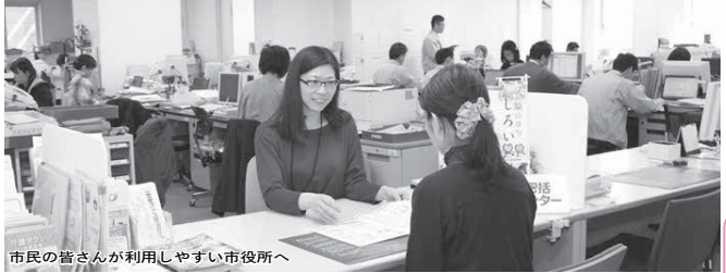
市民の皆さんが利用しやすい市役所へ

※身体障害者福祉センターの名称は「障害者地域活動支援センター」に変更となります。