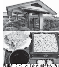
店構え(上)と「かき揚げせいろ」