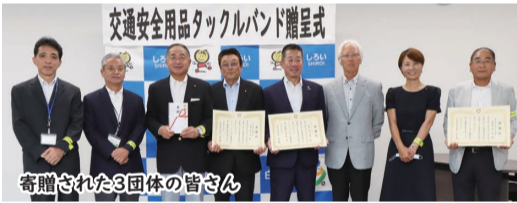
寄贈された3団体の皆さん