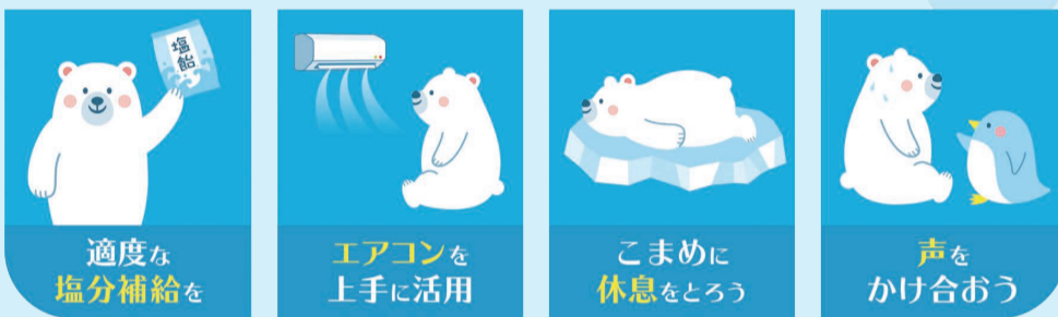
適度な塩分補給を