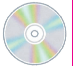
図 秘書課 ☎ 401-6913