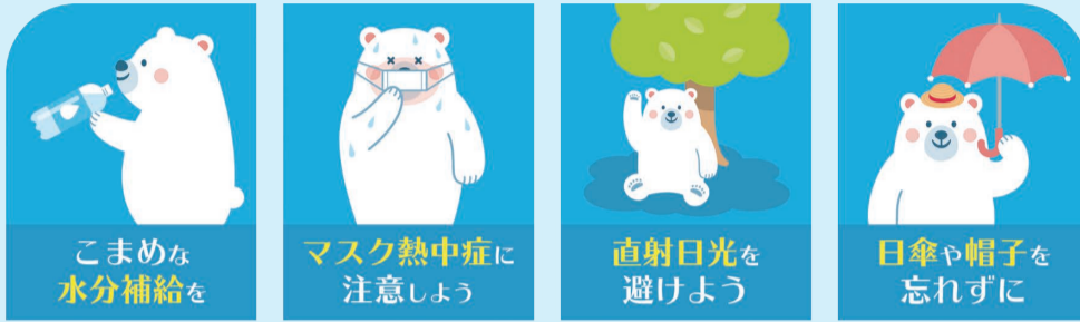
こまめな水分補給を