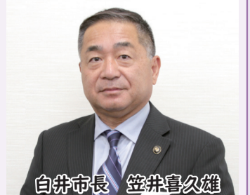
白井市長 笠井喜久雄

今回の受賞は市のさらなる発展につながるものであり、シニア世代のみならず多くの方に本市の魅力を知っていただく機会になったと考えております。この受賞を弾みに、引き続き、市民、事業者、行政とオール白井により「もっと豊かなまちづくり」を進めてまいります。