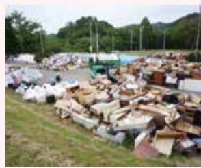
平成30年 北海道 胆振東部地震の様子

大規模災害時は大量の災害廃棄物が発生し、ごみの収集が滞ることが想定されますので、日頃から生ごみの水分を絞ることなどを習慣づけ、清潔な生活環境が保てるよう心がけましょう。