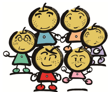
なし坊ファミリー 白井市マスコットキャラクター

ふるさと白井の広がる未来と地域の調和を象徴しています。輪の色、青は空と水を、橙は梨と大地と稲穂を、緑は森と田園を表現しています。 (平成11年12月24日制定)