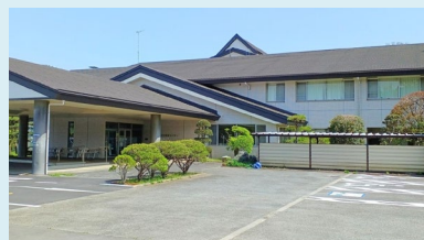
⑪福祉センター 〒270-1415 白井市清戸766-1