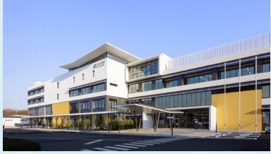
①白井市役所 〒270-1492 白井市復1123