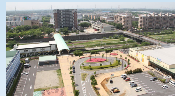
ニュータウンだから道路が広い

緑に囲まれた公園やテニスコート、野球場が併設された公園など用途も見た目もさまざま！ 映画撮影に使われた公園も！