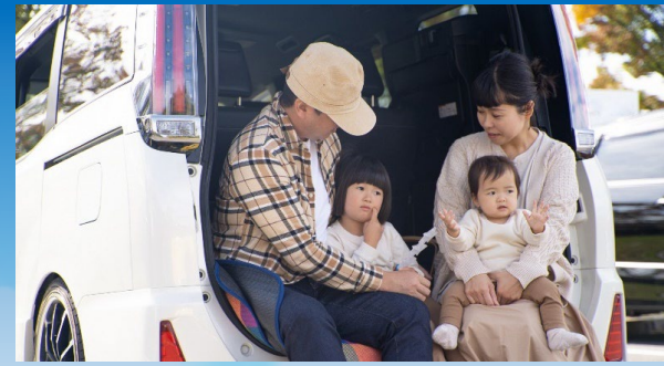
周辺には大型商業施設も

市を横断する国道464号と市を縦断する国道16号には大型商業施設が立ち並び、休日のお買い物にも便利です。市内には野菜や果物の直売所がたくさんあり、旬の食材や季節を感じることができます。