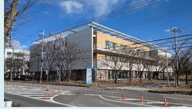
②保健福祉センター 〒270-1492 白井市復1123