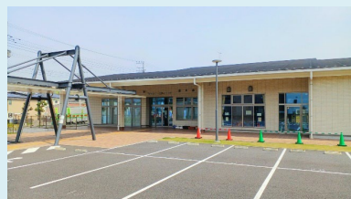
⑩西白井コミュニティプラザ 〒270-1408 白井市西白井2-16-1