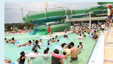
⑬白井市民プール 〒270-1416 白井市神々廻1699