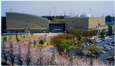
③文化センター 〒270-1422 白井市復1148-8