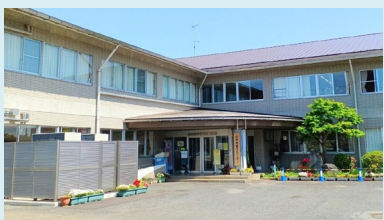
⑦富士センター 〒270-1432 白井市富士239-2