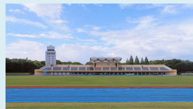
⑫白井運動公園 〒270-1416 白井市神々廻1728-1