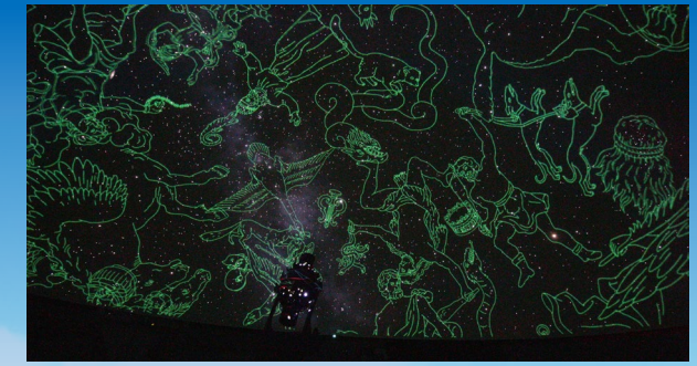
市役所や病院などが一カ所で安心

市を横断する国道464号と市を縦断する国道16号には大型商業施設が立ち並び、休日のお買い物にも便利です。市内には野菜や果物の直売所がたくさんあり、旬の食材や季節を感じることができます。