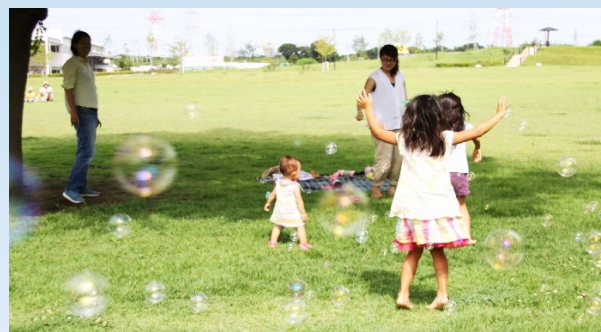
ひろーい公園がいっぱい！

緑に囲まれた公園やテニスコート、野球場が併設された公園など用途も見た目もさまざま！ 映画撮影に使われた公園も！