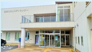
⑨白井コミュニティセンター 〒270-1422 白井市復1458-1