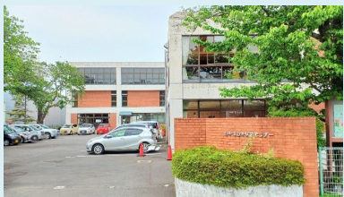
⑤白井駅前センター 〒270-1422 白井市堀込1-2-2