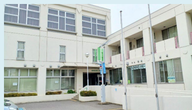
⑧公民センター 〒270-1406 白井市中98-17