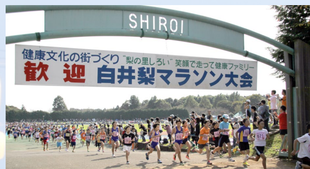
楽しいイベントがたくさん

ニュータウンとして大規模に整備されたまちだから、駅から広がる歩道や緑道は子どもを連れて歩くのにとっても安心です！