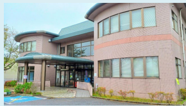
⑥桜台センター 〒270-1412 白井市桜台2-14