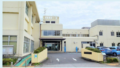
④西白井複合センター 〒270-1435 白井市清水口1-2-1