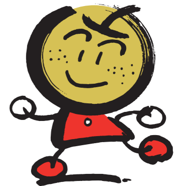
なし坊 白井市マスコットキャラクター