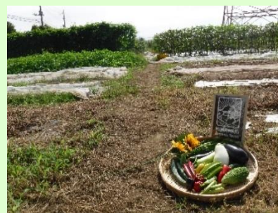
ひまわりオーガニックファーム

(広報しろい2020年12月1日号・2021年4月1日号「発見！白井の仕事人」より抜粋・編集)