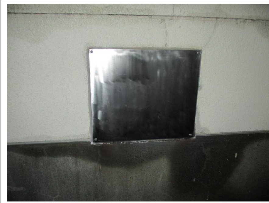
改修後 煙突点検口密閉