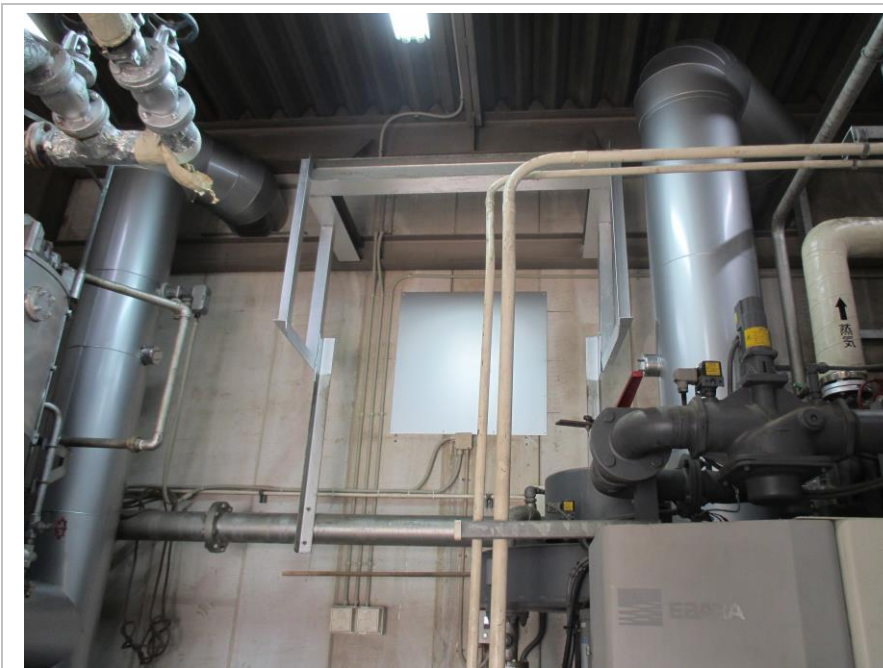
改修後 ボイラー室内煙道撤去及び密閉