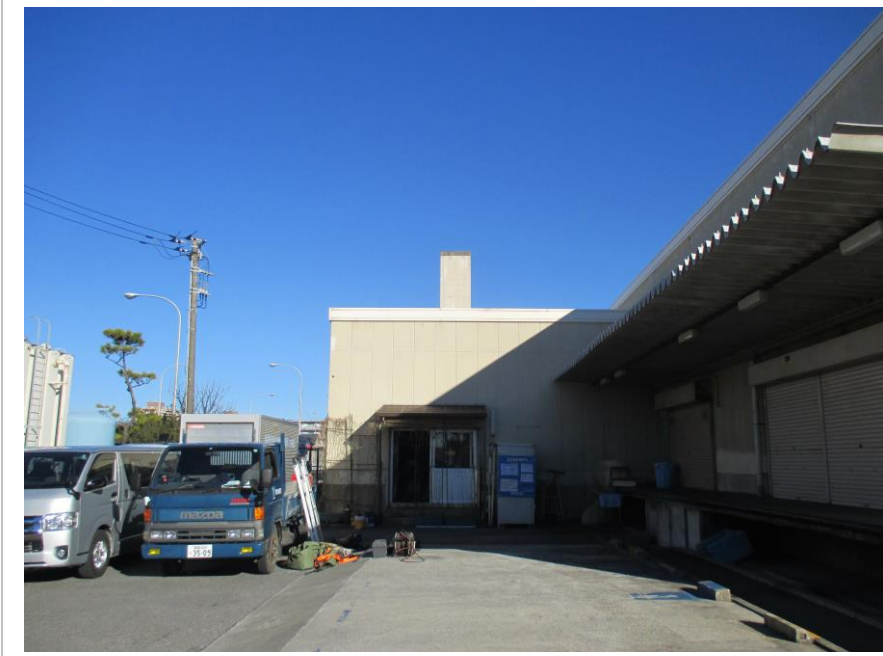
改修前 ボイラー室及び煙突 (正面)