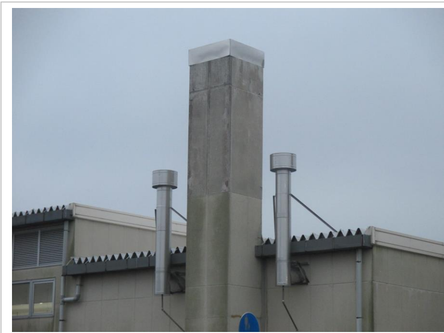
改修後 新たに設けた排気筒 及び煙突上密閉