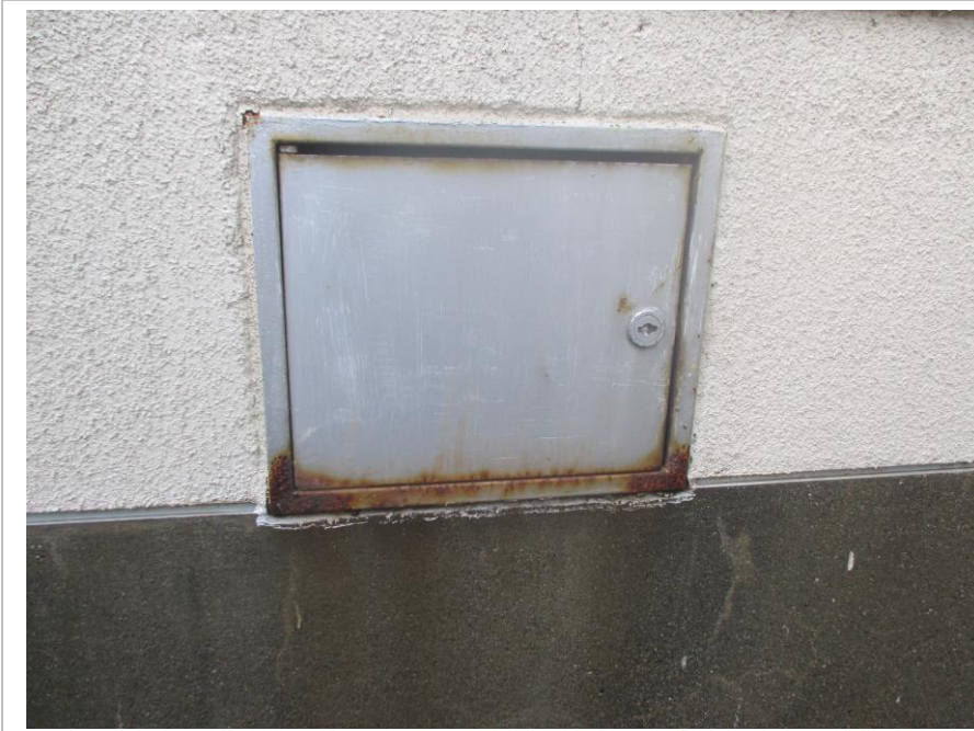
改修前 煙突点検口