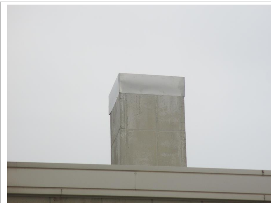
改修後 煙突上部密閉