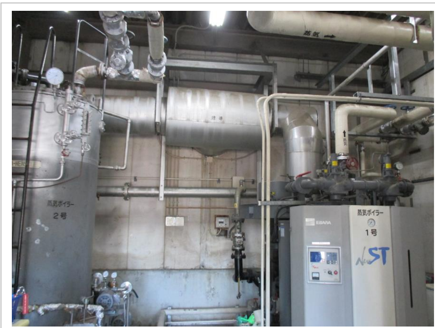
改修前 ボイラー室内煙道