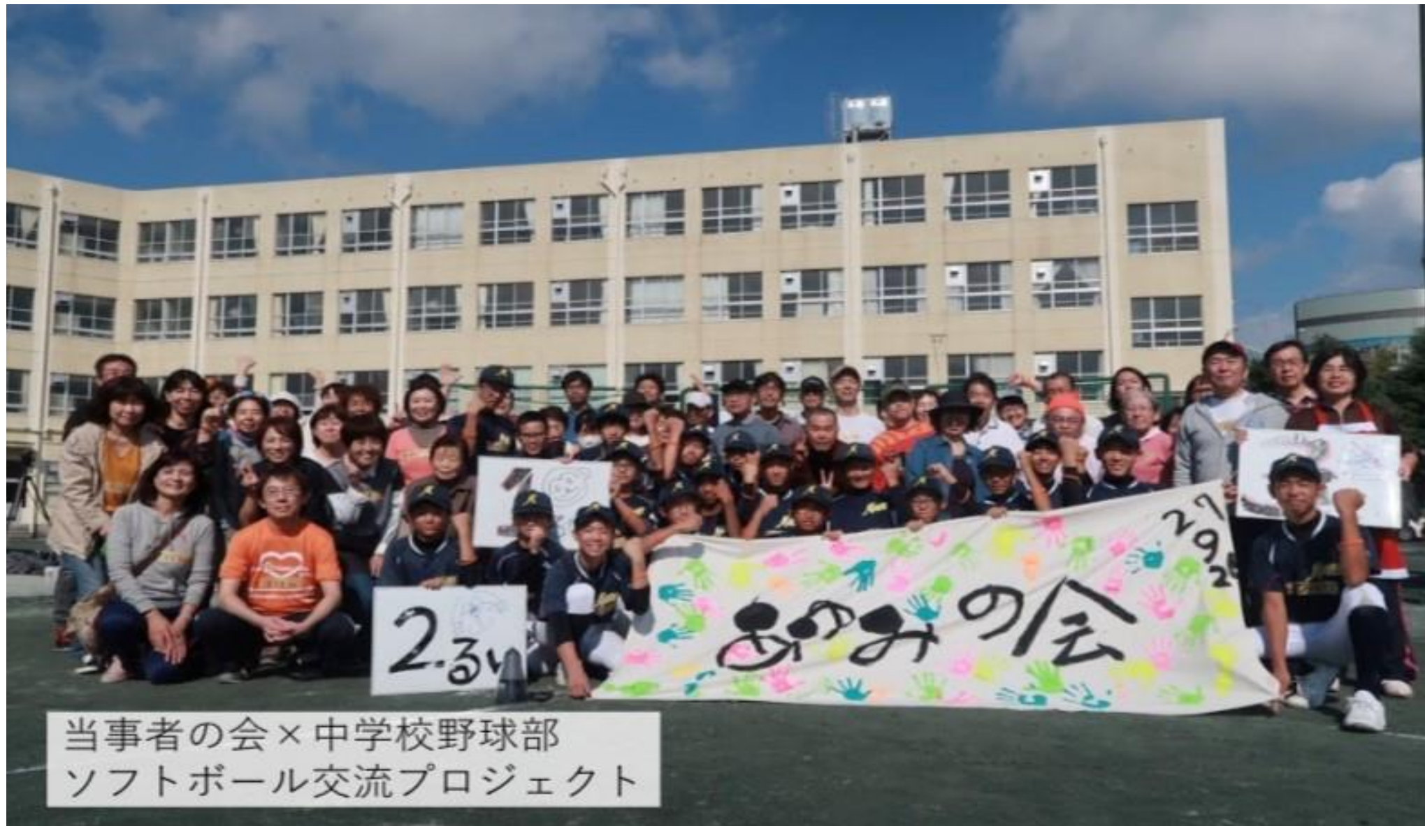
令和4年度 三重県伊賀市認知症講演会資料より