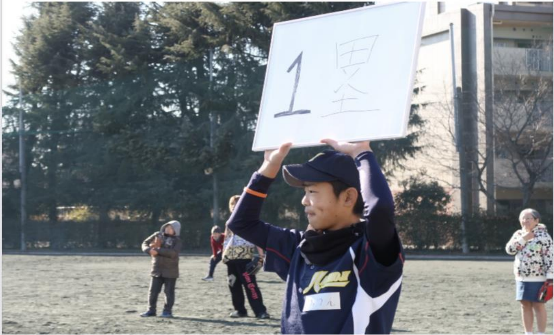
令和4年度 三重県伊賀市認知症講演会資料より