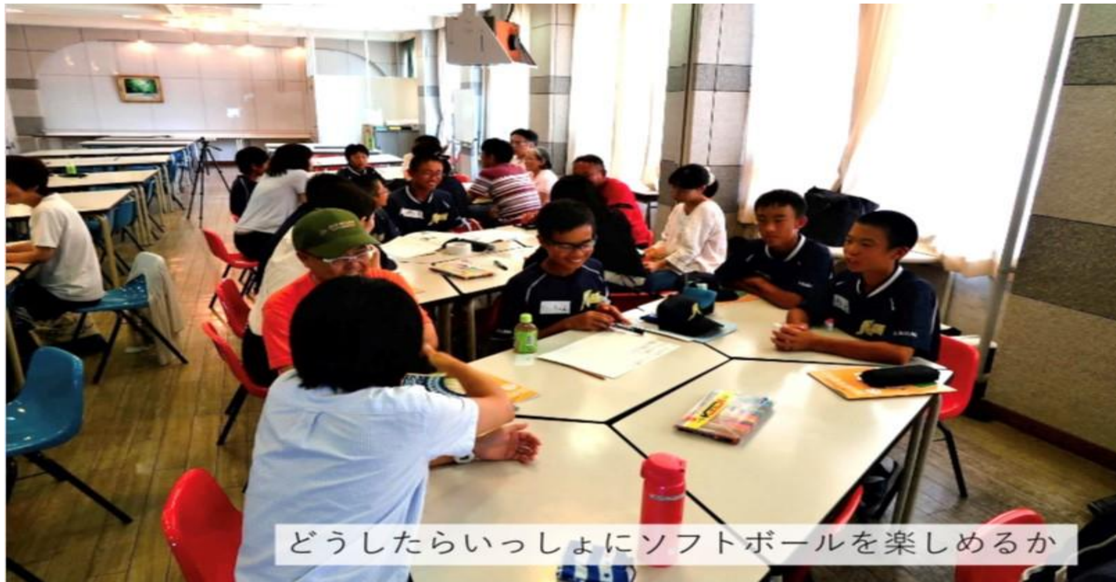
令和4年度 三重県伊賀市認知症講演会資料より