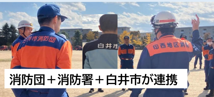
消防団 + 消防署 + 白井市が連携