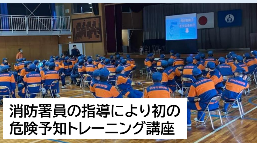
消防署員の指導により初の 危険予知トレーニング講座