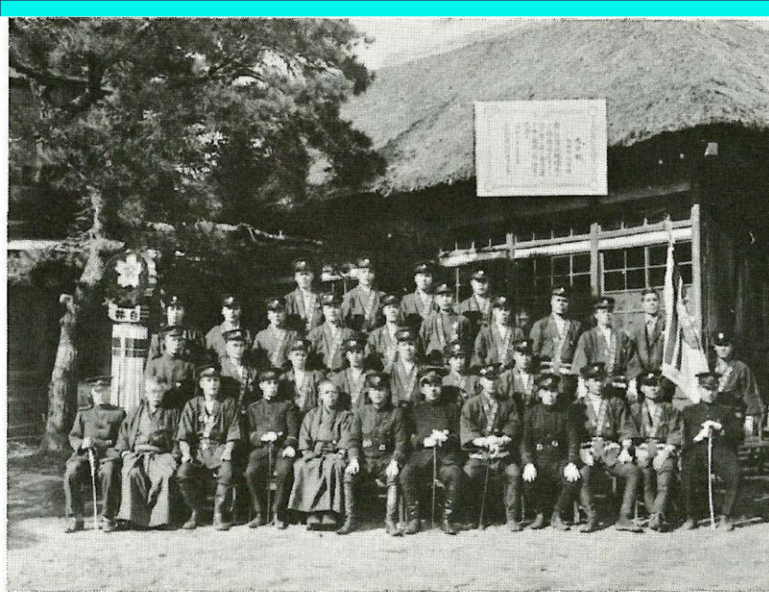
金馬簾受賞記念、旧白井小学校南側校庭で (俗につっかい棒学校と言った校舎)