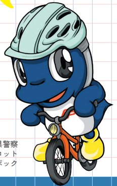
千葉県警察 シンボルマスコット シーボック