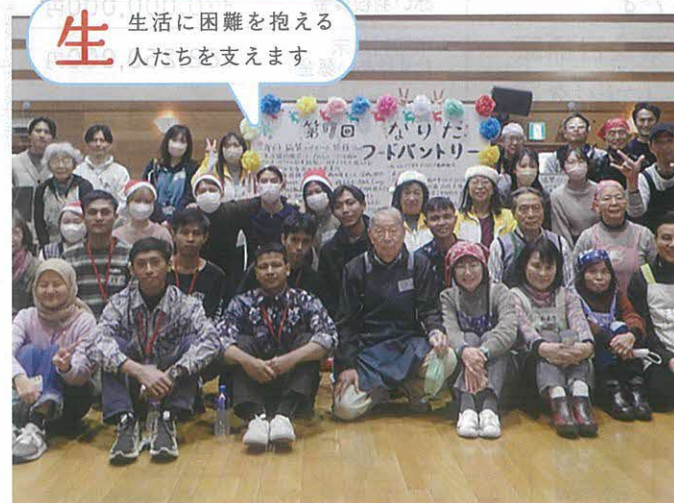
フードパントリー（成田市）