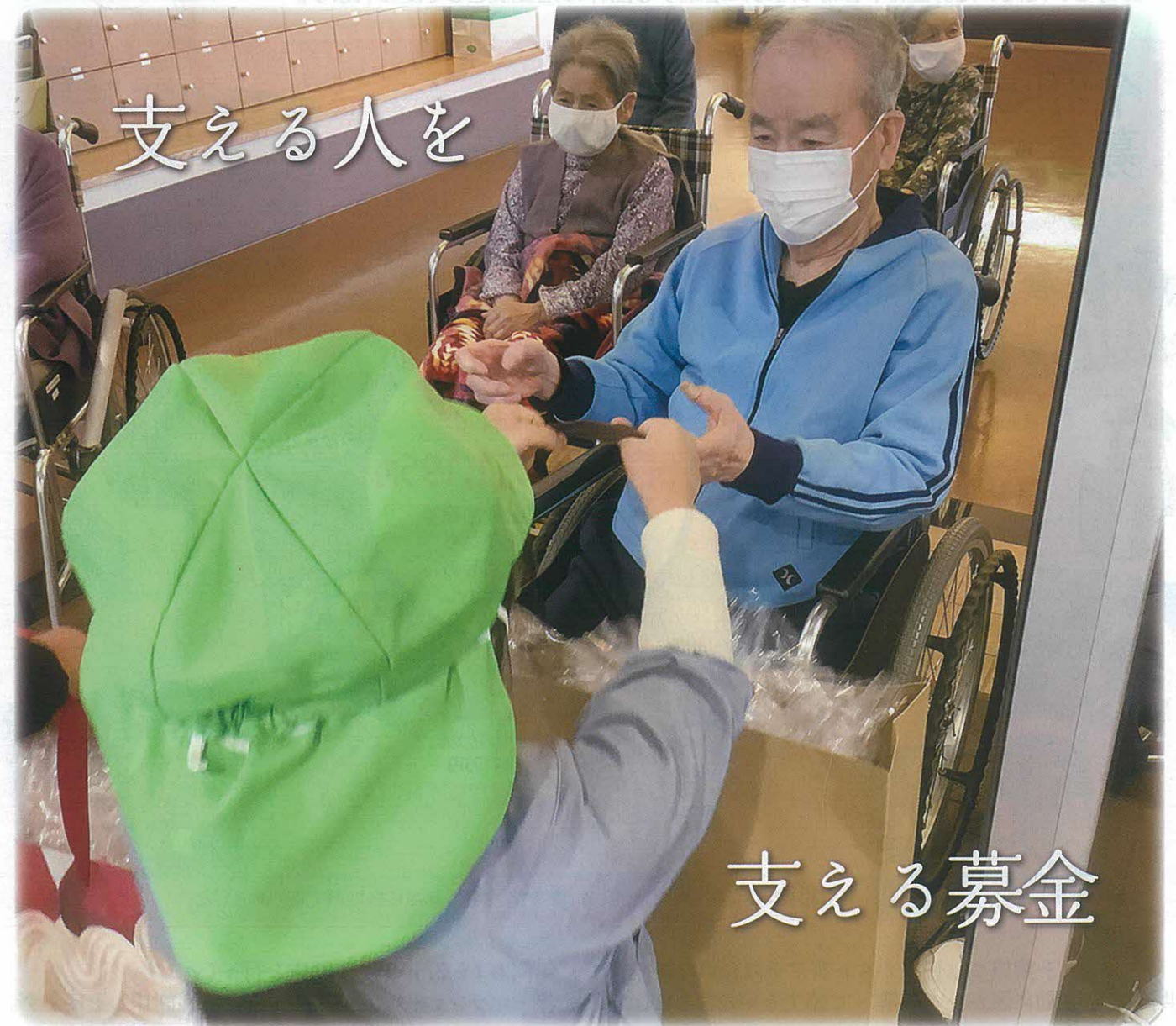
地域ふれあい事業(八街市)