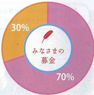
寄付をした市町村を良くする活動に