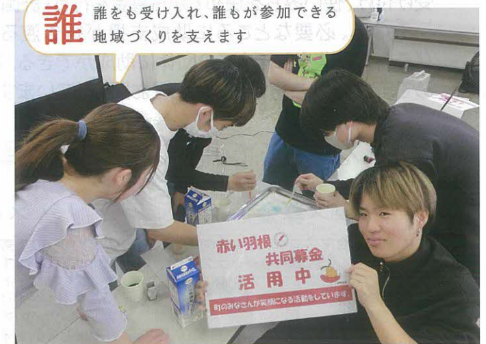
春休みボランティア体験～科学実験教室～（野田市）