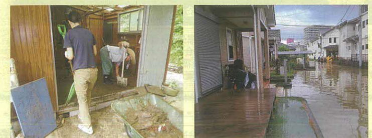
令和5年9月の台風15号接近による大雨災害復興支援