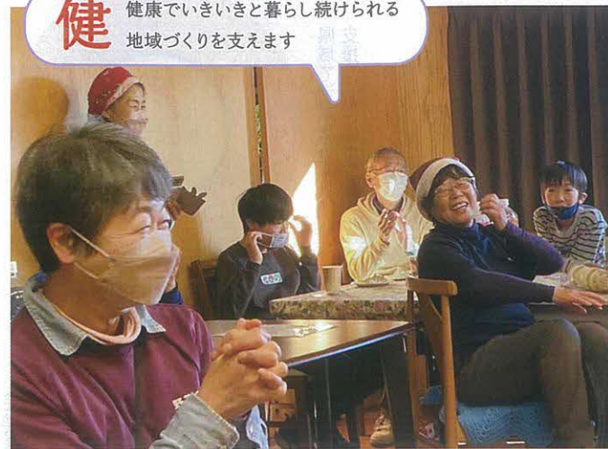
児童デイサービスクリスマス会（山武市）