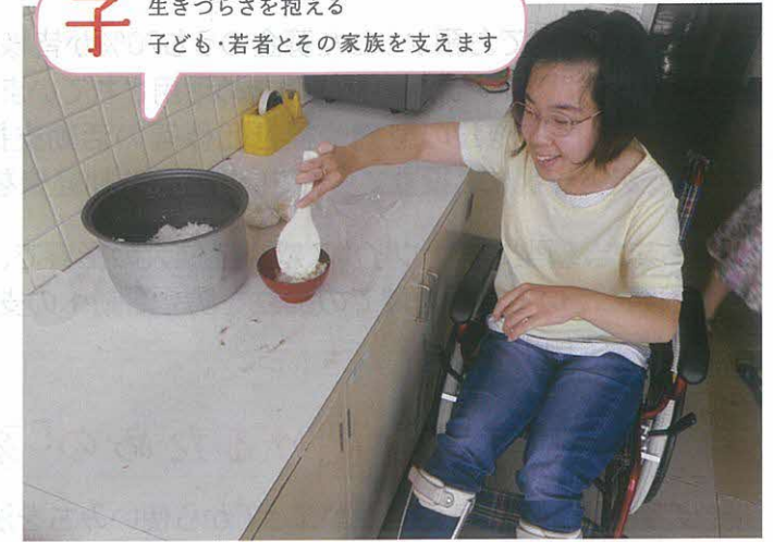
自立生活支援<体験実習>（千葉市）