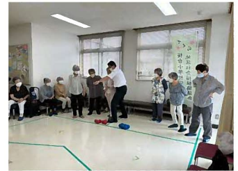
写真【ふれあいいきいきサロンでポッチャを体験(桜台小地区社協)】

令和5年度の千葉県助成総額約5億8千万円のうち、約4億2千万円は市町村の身近な福祉のために助成し、約1億6千万円は県域の福祉のために助成しました。白井市には地域助成金として177万3千円が配分され、地区社協活動などに使用しました。