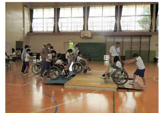
写真【大山口小学校4年生の車椅子体験のようす】

年代に関係なく、広く住民に貸し出しを行うため、生活援助用具(車椅子)を用意しています。6か月を限度として、怪我による通院、短期の家族旅行などさまざまな事情が必要な時に無料で貸し出しを行います。介護保険をご利用の方は保険でのご利用をお願いしています。また、車いすは小・中学校における福祉体験のときにも使用し、児童生徒の福祉理解に役立っています。