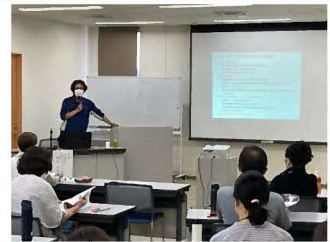
写真【NPO 法人千葉レスキューサポートバイクによる実践発表】

大規模災害に備えて、災害ボランティアセンターの立ち上げ・運営訓練を実施しています。職員をはじめ地区社協などの福祉関係団体の参加も得て、白井市における危機管理体制の把握、被災地での災害支援に実際に携わった講師による講演など、運営する側と支援するボランティアとに分かれてシミュレーションを行い、万が一というときの円滑な運営に備えます。