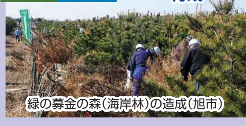
緑の募金の森(海岸林)の造成(旭市)