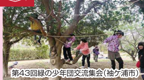
第43回緑の少年団交流集会(袖ヶ浦市)

SDGsとは 2030年に向けて 世界が合意した 「持続可能な開発目標」 です。