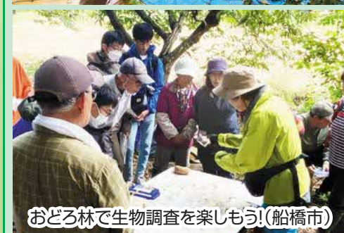
おどろ林で生物調査を楽しもう！(船橋市)