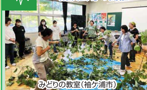
みどりの教室(袖ヶ浦市)