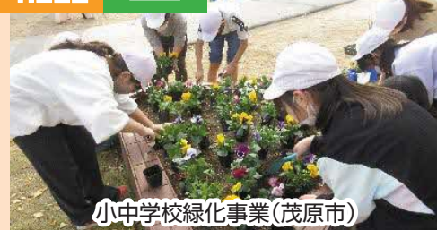
小中学校緑化事業(茂原市)