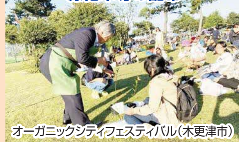
オーガニックシティフェスティバル(木更津市)