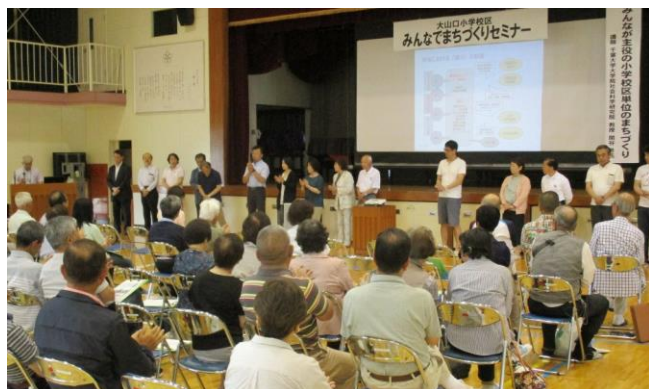
準備会メンバー発表の様子

大山口小学校区と白井第三小学校区がモデル小学校区に選ばれ、これまで地域の各団体の方たちが何度も話し合いを行い、8月25日（日）に各団体と公募委員の計19名による大山口小学校区まちづくり協議会設立準備会が設立しました。