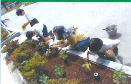
学校の緑化活動(佐倉市)