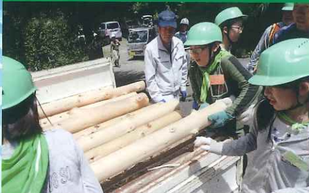
第39回緑の少年団交流会・体験林業(大多喜町)