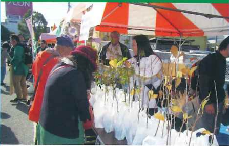
農畜産物収穫祭での配布会(木更津市)