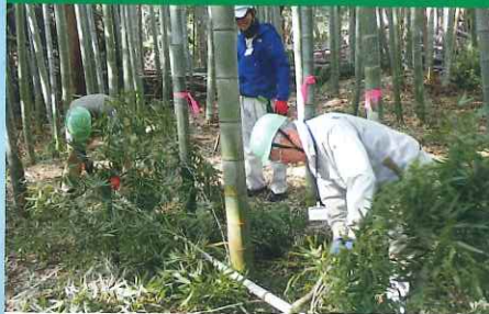
県民参加による緑の再生事業・竹林管理作業(千葉市)