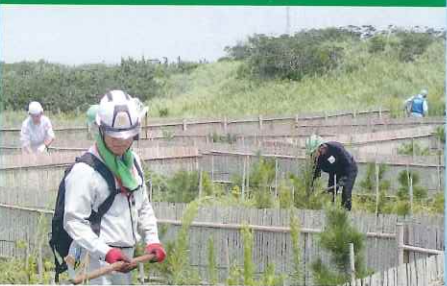
第2・緑の募金の森の造成(旭市)