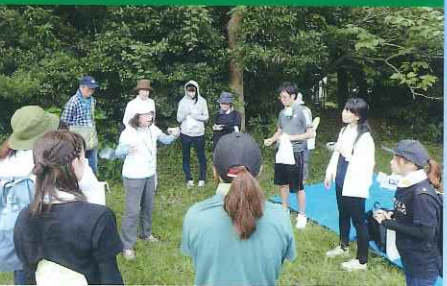
幼稚園教諭を対象にした研修会(袖ヶ浦市)