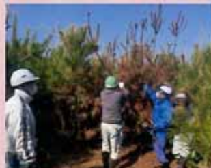
緑の募金の森 (海岸林) の造成 (旭市)