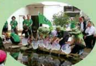
緑の少年団による学校や 地域の緑化活動 (流山市)