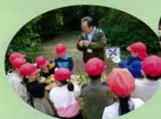
小学校の校外学習支援 (袖ヶ浦市)