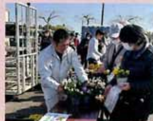
さんむ莓まつり (山武市)