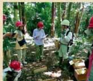
おとなの木育 (千葉市)