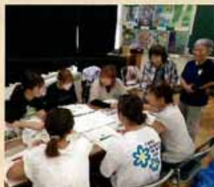
みどりの教室 (袖ヶ浦市)