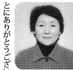
日頃より奉仕団活動にご理解とご協力を頂きまして、まこと

東日本大震災から9年が経ち今だに復興途上にある中、昨年は異常気象により千葉県も大型台風や大雨の影響で甚大な被害をうけました。私たち奉仕団は、義援金の募金活動や近隣市町との安否確認の情報交換を行いました。