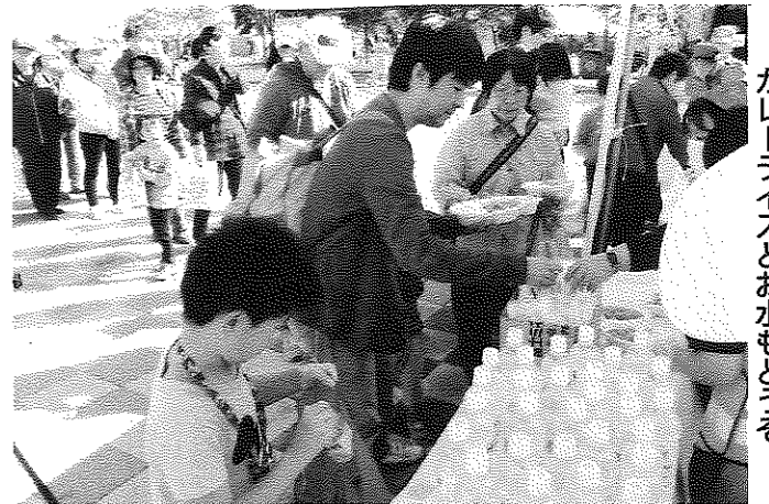
カレーライスとお水もどろぞろ

訓練に何度か千葉県会場を訪れたことがあった。仮設の避難所となつた体育館には一面にブルーシートが引きつめられ、家族で訓練に参加した一般市民の方々が、保存食の夕食をとっていた。私が思わず目を見張つたのは、自衛隊設置によるテント張り浴場の見事さだった。