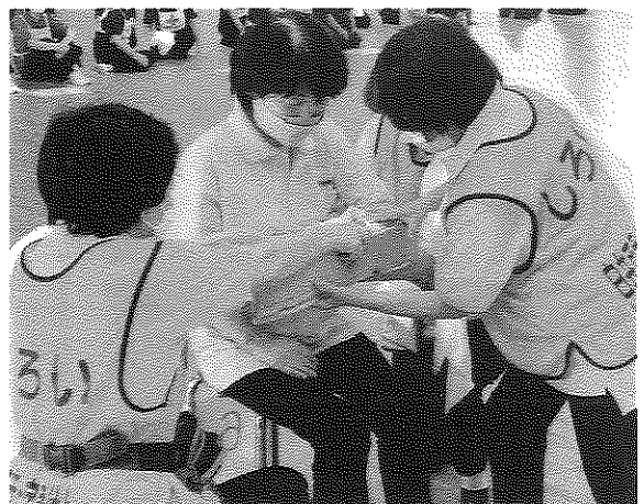
前腕骨折の手当て

た。三角巾、副木、タオルを用いて前腕中央部の骨接の手当を行いました。参加者は77チーム集まり、1チーム4名で傷病者1名、救助者3名で制限時間は6分です。副木を使って骨折の手当は初めてでした。傷病者に優しく声をかけながら、また、救助者も声をかけ合って協力しながら骨折の手当てをしました。4人の練習する日がなかなか合わず数回の練習によりフェスタの日が来てしまいましたが、みんな頑張ってだったので優秀賞を頂くことができました。