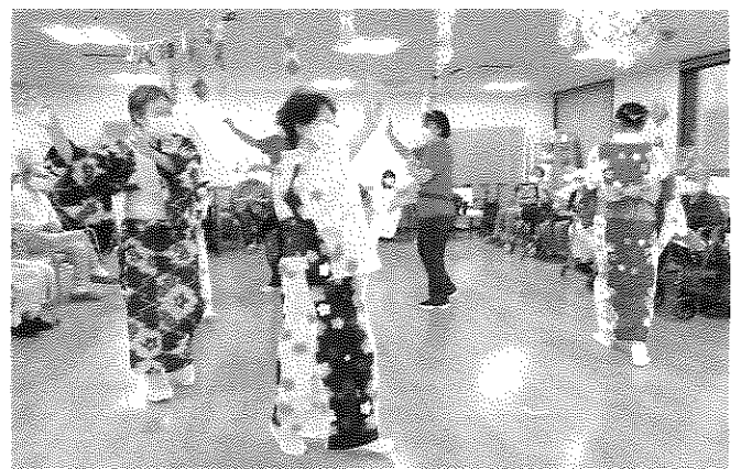
皆さんで楽しく盆踊り

8月11日(金)有料老人ホーム「ウイズホスピタル千葉白井」で夏まつりが開催されました。新型コロナウイルスが5種になり、地域高齢者支援活動が再開しましたので、私たち奉仕団8人がボランティアで参加して入居者の皆さんと一緒に、盆踊りを楽しみました。奉仕団のメンバーと職員の踊りの輪がひろがると、初めは遠慮されていた入居者の方々も、炭坑節の曲が流れると「知ってるよ」と言いながら口ずさみ、椅子に