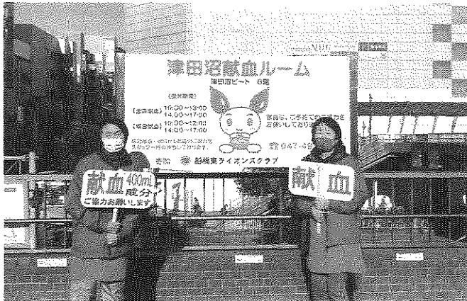
津田沼駅前で呼びかけ

に協力いただけるよう呼びかけをしました。大きな声で呼びかけをし、協力してくださる方には、感謝をしながら献血ルームへご案内しています。そして時には献血ルームで軽作業を行ったりもします。病气やけがなどで輸血を必要としている患者さんの尊い生命を救うためにできるだけ沢山の皆さんに協力をしていただければ、私も心をこめて呼びかけたいと思います。