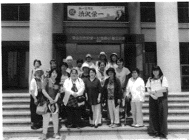
記念館の前でパチリ