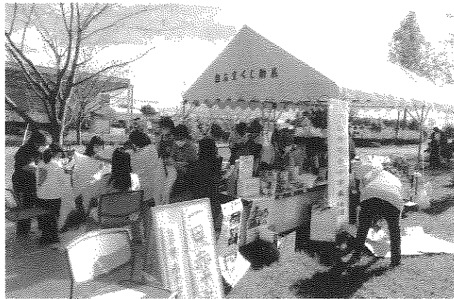
三角巾の講習(一日赤十字)

袋が市販の湯せんの出来るポリ袋で代用できることも説明し和やかなうちに終了することができました。