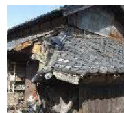
緊急代執行を要する崩落しかけた屋根