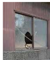
窓が割れた管理不全空家