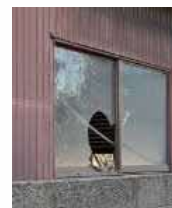
窓が割れた 管理不全空家