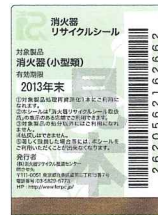
既製品用シール(見本)